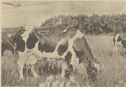
Z naszych hodowli:

Pasienie zwierząt jesienią. W czasie chłodnych deszczowych dni jesieni morka pasza nie zawiera już wielkiej ilości składników pożywnych, i już dla tego samego nie może być gorąco polecana.