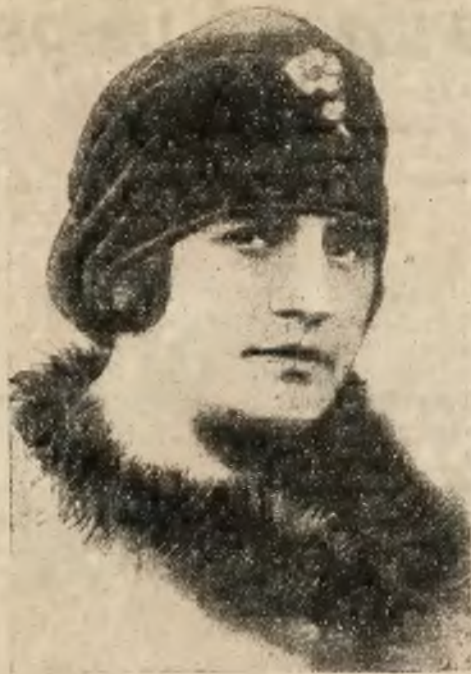
SURAJA, żona króla Amanullaha, liczy obecnie 28 lat, wyszła w dwunastym roku życia za mąż i ma dotychczas ośmiorgo dzieci.

„DOM WYSYŁKOWY MERKURY”, Łódź 11, ul. Piotrkowska Nr. 37, skrzynka pocztowa Nr. 487.