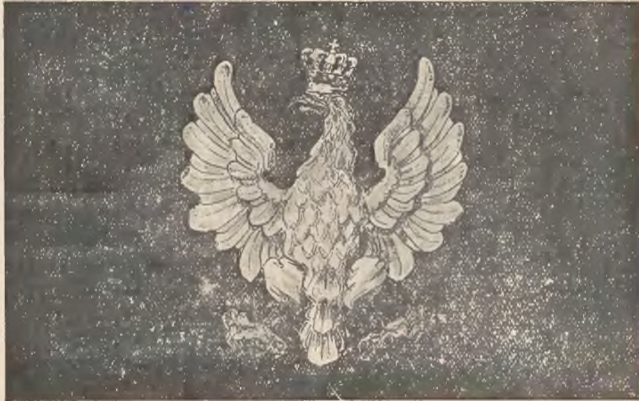
Wzór № 5.