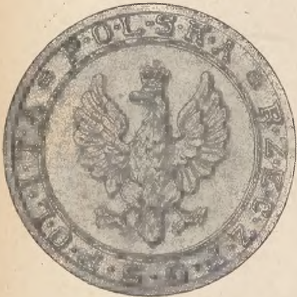
Wzór № 1.