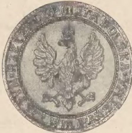
Wzór № 2.