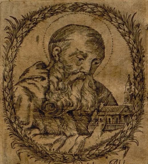
Sanctus Romualdus Abbas Carnaldiensium Pater.