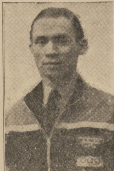
Bohater sportowiec - hokeista (do artykułu „Armata walij” na str. 3-iej)