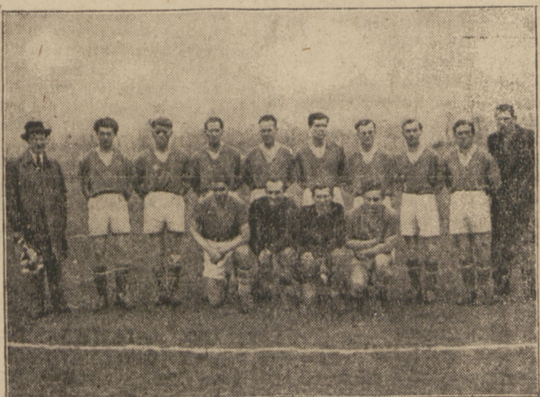
Na zdjęciu zespół Polonii Świdnickiej, która w walkach o wejście do Ligi zdobyła wczoraj swój pierwszy punkt, i so na nią była kim, bo na niej imię B-31387