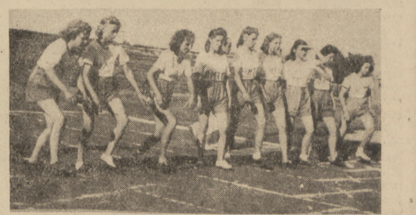
Start biegu pań na 500 mtr.

MĘCZYZNI: 100 m - 1) Buhl (Z. H. P.) 10,9; 2) Lipski (Z. H. P.) 11,1; 3) Kiszka (K. C. Z. Z.) 11,2; 400 m - 1) Buhl (Z. Z. P.) 51,6; 2) Grzanek (Z. H. P.) 52,6; 3) Sysak (OMTUR) 55,4; 800 m - 1) Nowak (Z. H. P.) 2:02,5; 2) Rzeźniczek (OMTUR) 2:07,0; 3) Zmorski (Z. W. M.) 2:10. Poza konkursem Staniszewski - 2:01,6; 1500 m - 1) Nowak (Z. H. P.) 4:19,4; 2) Dzwonkowski (Z. W. M.) 4:20,9; 3) Zaprał (OMTUR) 4:22,4; 5000 m - 1) Dzwonkowski (Z. W. M.) 16:19,0; 2) Zadrożny (OMTUR) 16:36,8; 3) Kurowski (Z. H. P.) 16:51,8; 4 x 100 m - 1) Z. H. P. I - 45,0; Olimpijska - (800 x 400