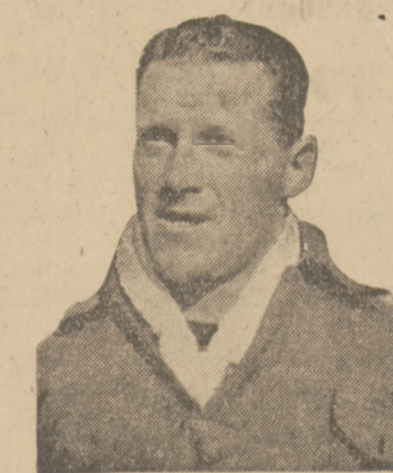
Łomowski — kula — 14,67 m, dysk — 42,25 m