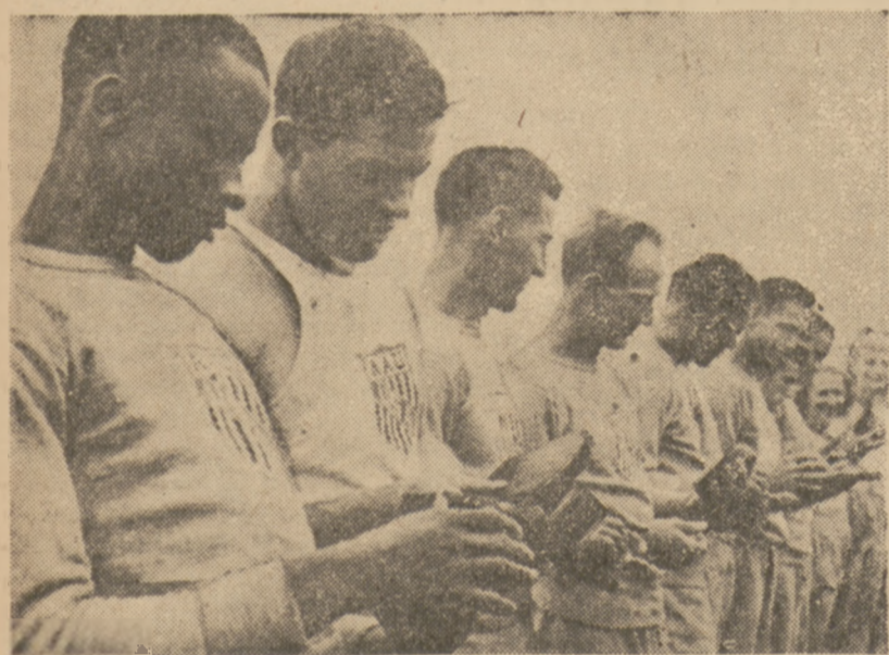
Moment z przywitania zespołu lekkoatletów amerykańskich na boisku Pogoni w Katowicach. Goście trzymają w dłoniach prezenty wręczone im przez organizatorów.

Od czasów Paddocka biali biegacze nie mieli wiele do powiedzenia w sprintach. Kilkunastu murzynów potrafiło osiągnąć 10,3, Owens przebiegł 100 m nawet w 10,2, a żaden biały Amerykanin nie mógł zrobić tego co Paddock przed dwudziestu paru laty.