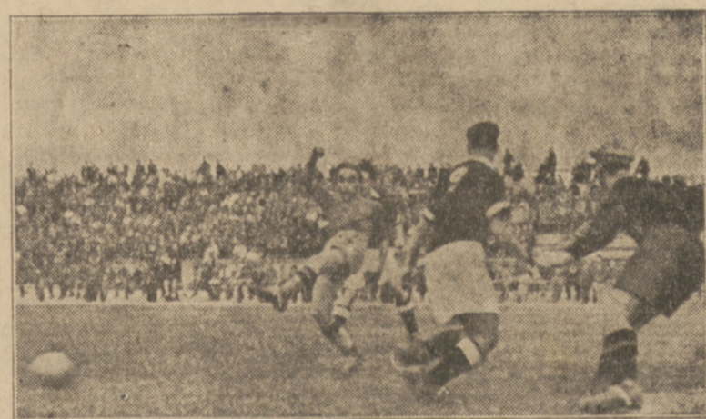
Niedzielnny mecz piłkarski Polonia — Skra toczył się przeważnie na polowie gości. Na zdjęciu widzimy atak polonistów walczący o górną piłkę z obroną Skry.