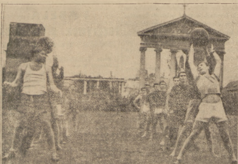
Tak wygląda fragment zaprawy jaką przechodzą nasi czołowi hokeiści