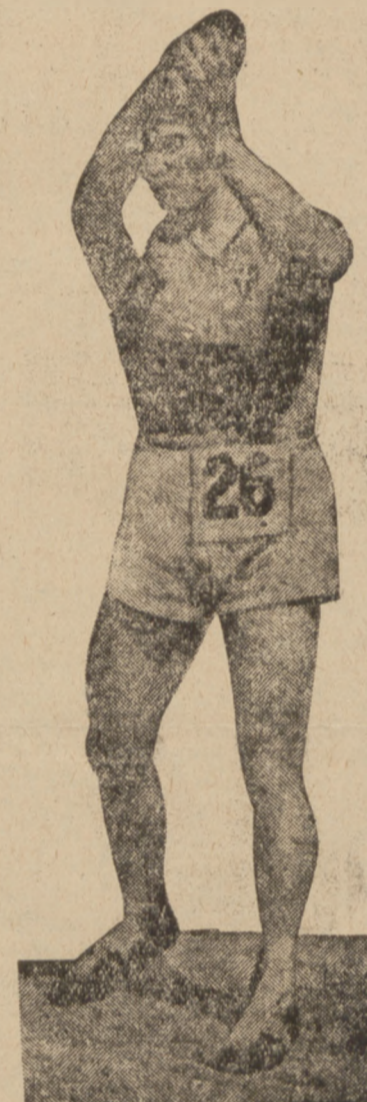
Najlepszy dyskobol Europy, Włoch Consolini, jest jedynym konkurentem dla Amerykanów na najbliższą Olimpiadę. Swoją tegoroczną sezon zakończył on doskonałym rzutem 52,98