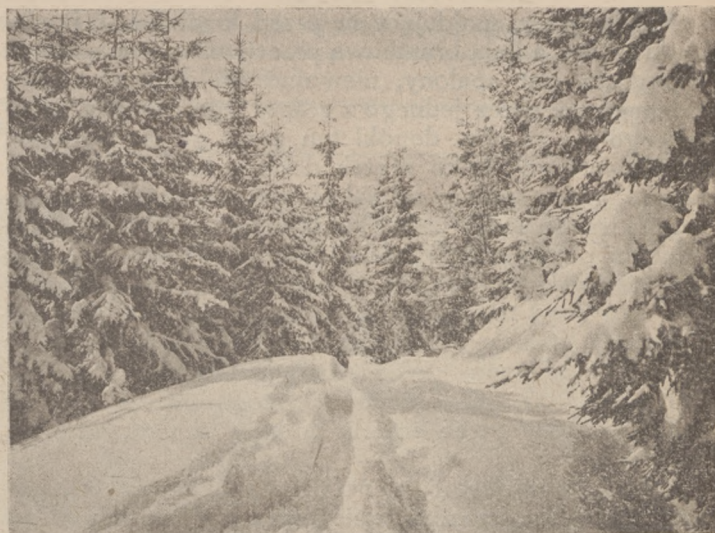
Wycieczka S. N. Czarni do Sławska. Droga na Trościan.

Gra składa się z dwóch części po 20 minut z przerwą pomiędzy nimi nie dłuższą jak 10 minut. Podczas przerwy zmieniają drużyny strony.