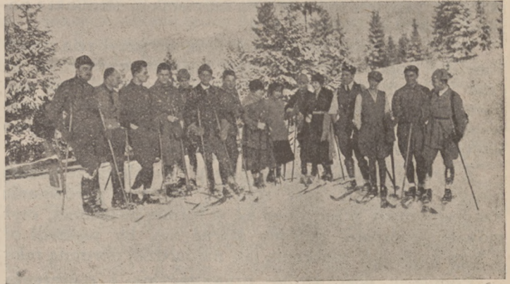
Wycieczka S. N. Czarni do Sławska.

olbrzymich wysiłków finansowych na ich zaopatrzenie i utrzymanie. Korzystający z nich winni tedy pamiętać, że z ich strony należy się schroniskom jak największe poszanowanie, jak najtroskliwsza opieka, i że wszelkie, drobne nawet uszkodzenia obowiązani są natychmiast po powrocie zgłosić i szkodę wyrównać. Klucze do schronisk otrzymać może każdy, włamania więc nie są niczem usprawiedliwione i świadczą tylko o smutnym poziomie kulturalnym naszych turystów. Wobec wysokiego kosztu i trudności przygotowania drzewa opałowego,