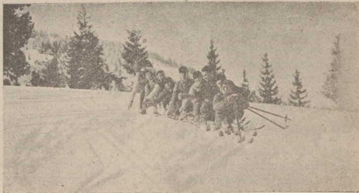
Wycieczka S. N. Czarni do Sławska.