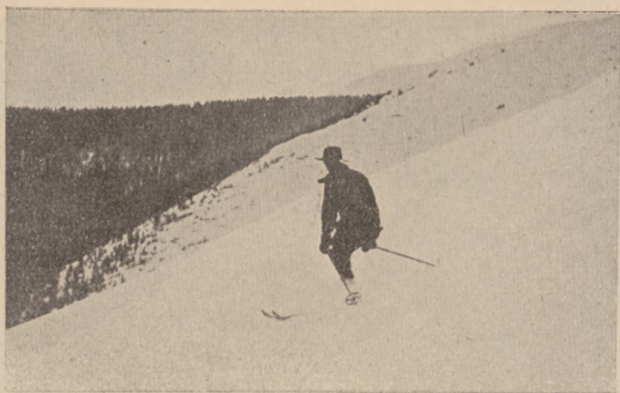
Zjazd w stromym terenie, w pozycji półkucznej.

przeczenie bardzo wyraźne oblicze swoistego, u nas wypracowanego stylu. Styl ten, będący wynikiem psychicznych właściwości narodu — a zwłaszcza jego części u stóp gór żyjącej — jest nabytkiem tak cennym, że żadną miarą nie powinno się oddać go na zagładę przez przyjęcie szablonu mody zagranicznej i dosłownie przyjętych wzorów sportowych. Nie można oczywiście zapoznać zdobywcę sportu międzynarodowego, przedewszystkiem zdobywcę na polu opanowania techniki biegu, skoku i jazdy w terenie — ale przy tem wszystkim zważać należy, ażeby — zwłaszcza przy zawodach w kraju — tworzyć takie warunki, aby styl ten nie tylko utrzymał się, ale i rozwijał w dalszym ciągu.