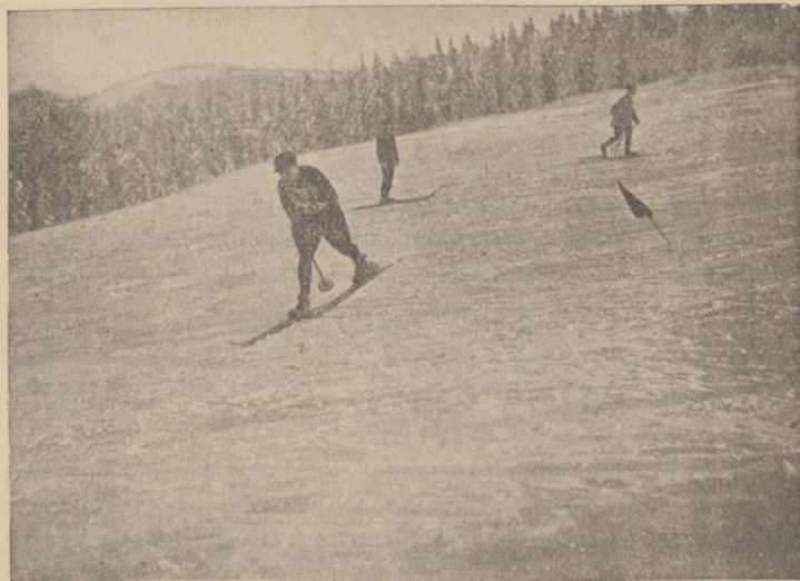
Bieg narciarski po równem.