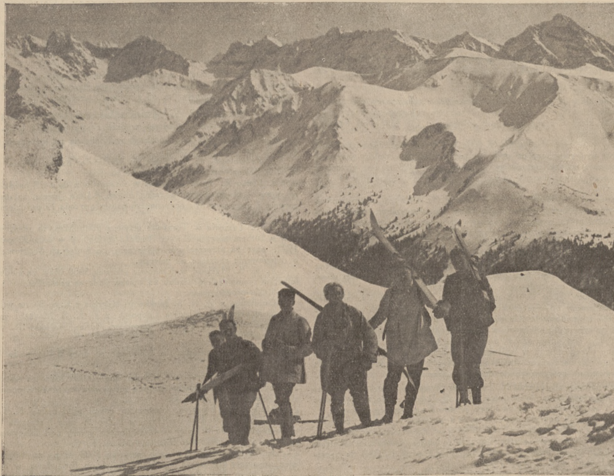
Tatry w zimie. Z przejścia grani „Czerwonych Wierchów“.