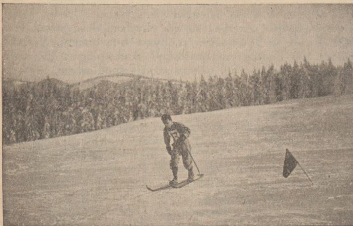
Bieg narciarski po równem.

ale nawet strzelić przyznanego jej rzutu karnego. Polonia natomiast rzut taki wyzyskuje ładnie przez Zelechowskiego i już pod koniec gry po pięknym przeboju Zantmana na lewym skrzydle i po centrze stamtąd Grabowski zdobywa bezapelacyjnie czwartą bramkę.