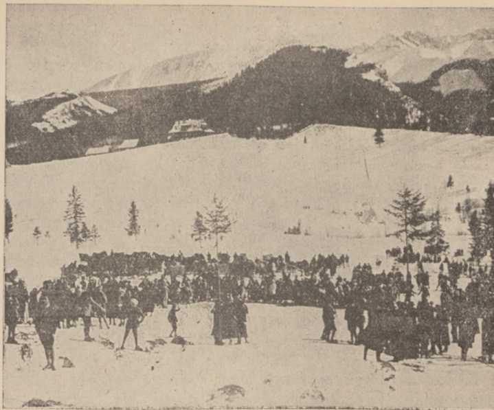
Teren biegu płaskiego.

Z chwilą pierwszych opadów śnieżnych nastają dla trenującego zawodnika weselsze dni. Wtedy staje on na ulubionych nartach i może pracować już dokładnie w znanych sobie warunkach. Nie powinno się od razu „całą parą“ biegać, lecz po dwu trzech przejażdżkach, mających na celu przypomnienie techniki, można przystąpić do kilkunastominutowych biegów. Przy końcu drugiego tygodnia od chwili wyjścia na nartach można określić trening jako dobrze rozpoczęty. Od tego też dnia trenować należy z przerwami codziennie —