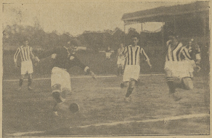
Z zawodów Polonia (Warszawa) - Jutrzenka w Krakowie

Warta II.—Pogoń 4:1 (1:0). Warta II. zdobyła tym samym mistrzostwo klasy B. Pozn. Z. O. P. N., wygrywając w wszystkich spotkaniach grupowych i międzygrupowych. Sz.