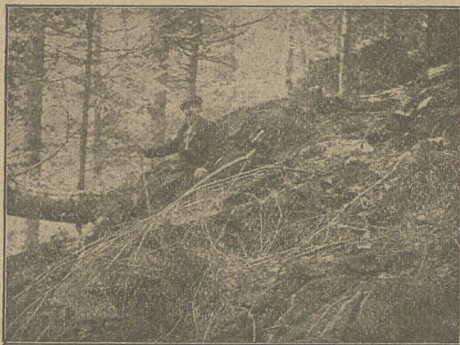
Perć „wściekła“ w Roztoce Wielkiej.

Po Tatrach najważniejszym ośrodkiem turystycznego ruchu jest Babia Góra. Ma ona już dość liczne uprzystępnienia, a to dwa schroniska i sieć dróg dobrze wyznaczonych. Jednak urządzenia te już obecnie okazują się niewystarczającymi.