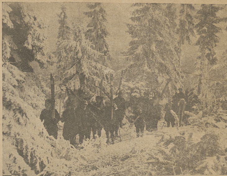
Kurs narciarski Tatrzańskiego Tow. Narc. w Krynicy.

Ta zmiana w zapatrywaniach naszych nie była ani łatwą, ani też nie dokonała się zupełnie do dnia dzisiejszego. Nasze narciarstwo sportowe wyszło z narciarstwa turystycznego i rozwijało się pod przeważającym znakiem opanowania techniki zjazdowej, brawury i śmiałości w jeździe. Było to piętno tak wybitne, że zjednało nam w spotkaniu z zagra-