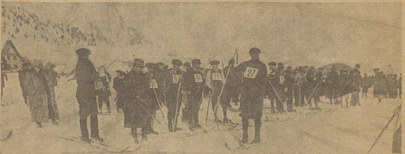
Z francuskich zawodów narciarskich w Chamonix. (Start patroli wojskowych.)

Cross country (bieg na przełaj) niesłusznie zupełnie jest u nas uważany za rodzaj ćwiczenia wstępnego do sezonu wiosennego. Powinien stać się u nas ćwiczeniem odbywa-