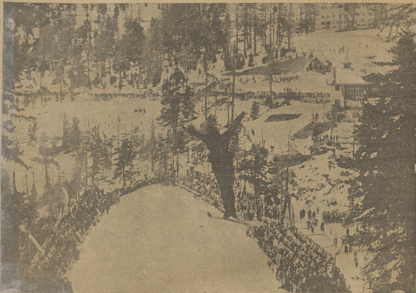
Wielka skocznia narciarska w St. Moritz t. z. „Bolgenschanze“.

TYGODNIK ILUSTROWANY, POŚWIĘCONY WSZELKIM GAŁĘZIOM SPORTU