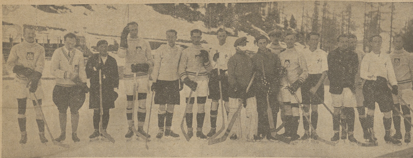
Drużyny A. Z. S. Warszawa i Milano H. C. w stadjonie w St. Moritz przed grą.