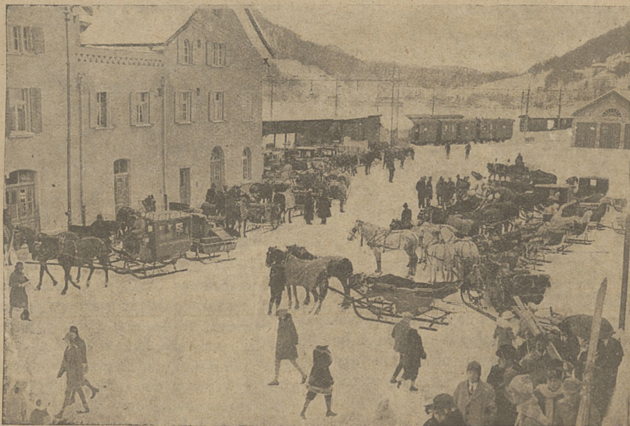
Światowa stolica sportów zimowych. Stacja kolejowa w St. Moritz.

Realny pierwszy krok jest już zrobiony. Oto na zbo-