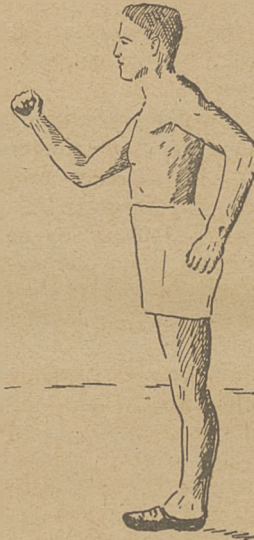
Ćwiczenie ruchu rąk.

Ćwiczenie złożone rąk i nóg. Ćwiczenie to robimy na miejscu. Jednocześnie z kołysaniem rąk (jak wyżej), podnosimy kolana na zmianę i opuszczamy na ziemię. Rysunek