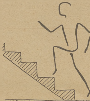
Wchodzenie na palcach, co dwa schodki