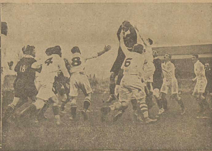
Nowo zelandzka drużyna rugby „All Blaks“ (całkiem czarni) w Anglii.

1) Powitanie drużyny przez księcia Walji — 2) Scena z gry, All Blaks—Reprezentacja Anglii.