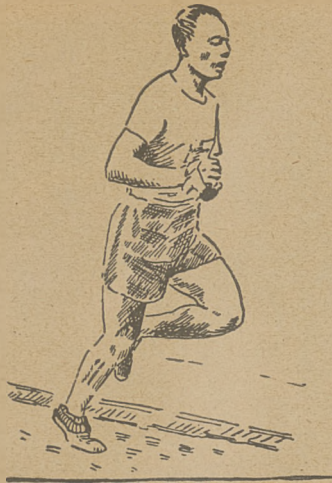
Krok średniodystansowca Widego (Szwecja)

najlepiej wskaże nam to ćwiczenie. Pamiętajmy zawsze o tem, by kolana nie odchyłały się na boki. Przy podnoszeniu nóg, prężmy palce stopy i stopę do góry.