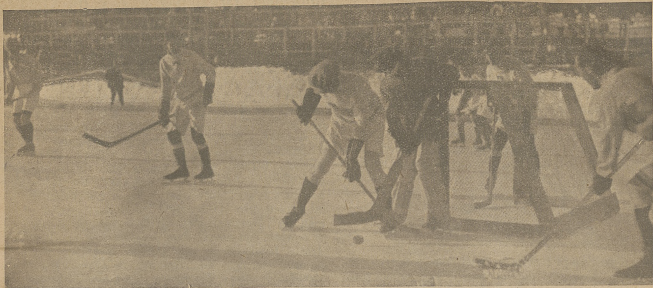
E. H. C. St. Moritz—A. Z. S. Moment pod bramką warszawską.