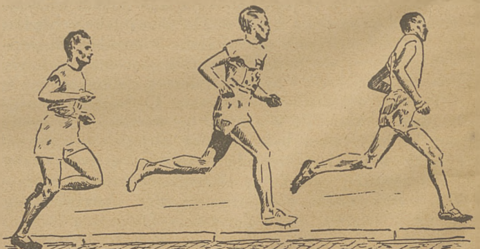
Krok Widego (Szwecja), Ritoli i Nurmiego (Finlandja). U Nurmiego widzimy ogromny spokój ruchów.