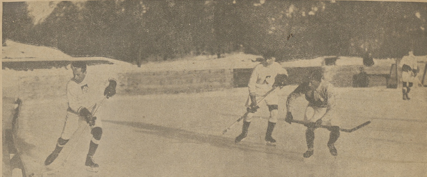
Z matchu E. H. C. St. Moritz—A. Z. S. Rybak przeprowadza krążek obok ścianki.

najlepszy gracz Anglii, w pełnym pędzie strzela górą z pół boiska (30 m.) i trafia do bramki. Pozostali napastnicy nie wiele mu ustępują.