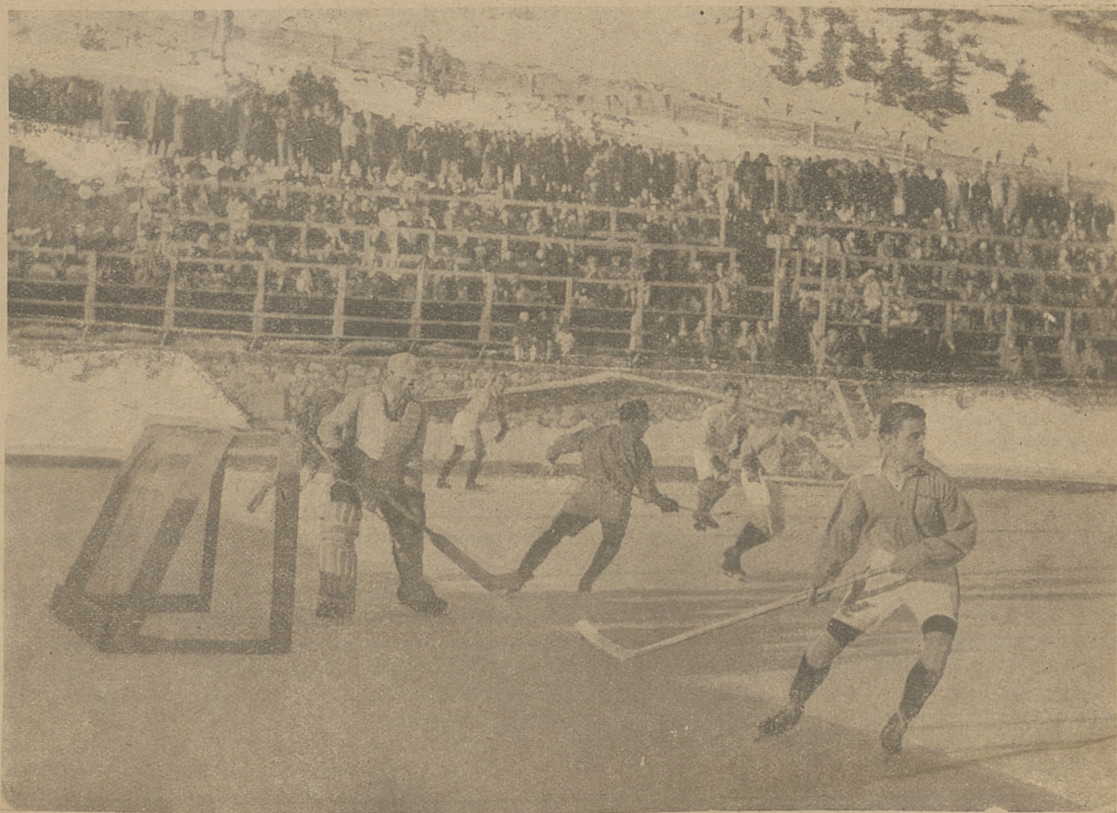
Z sezonu zimowego w Szwajcarii. Scena z gry London Lions—H. C. St. Moritz.

W tej sprawie nie napisałem zresztą w moim artykulu nic nowego. Byłoby wielką i bezpodstawną... odwagą wymyślać nowe jakieś tezy, zamiast spożytkować badania naukowe i doświadczenia praktyczne krajów, w wychowaniu fizycznym znacznie nas wyprzedzających. Rozpęd młodzieży