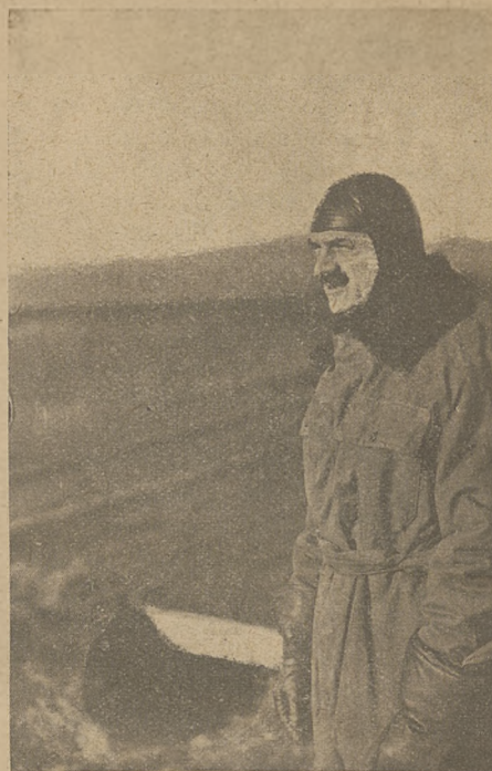
Szef lotnictwa gen. Zagórski.

Charakterystyka tych płatowczyków przedstawia się na-