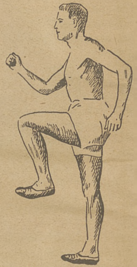
Ćwiczenie złożone rąk i nóg.