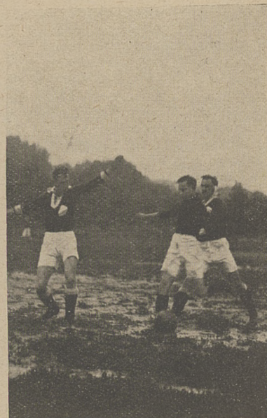
Niebezpieczny atak na bramkę Polonii.