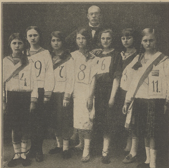
Zwycięska drużyna dziewczęca w biegu rozstawnym na przestrzeni 1250 mtr. Z tyłu prof. Garbacki.

Prenumerata „Przeglądu Sportowego“ wynosi: