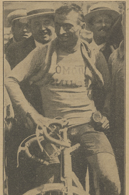
Włoch Bottecchia, zeszłoroczny zwycięzca Tour de France.