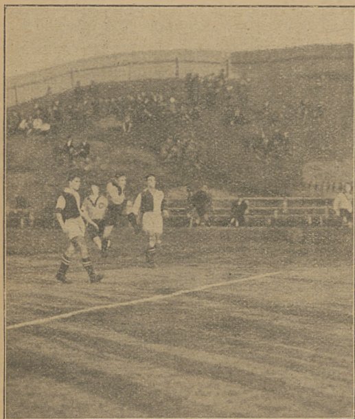
Piękny strzał Wróbla.

1 P. P. Leg. (Wilno) bije Warszawiankę 3:1 i Legję 4:1.