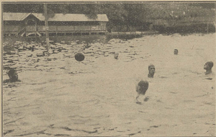
Piłka wodna we Lwowie. A. Z. S. — Drużyna kombinowana 3:0.