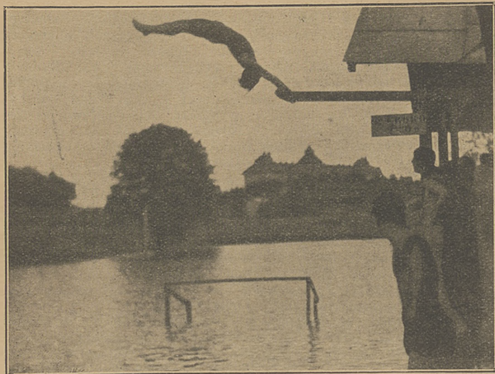
Hara (A. Z. S.) w skoku.

Zawody drużyn szkolnych kuratorjum krakowskiego. Rzucony od kilku lat siew zaczyna wydawać owoce, świadczące chlubnie tak o zdrowej myśli i troskliwości, z jaką tutejsze sfery pedagogiczne odnoszą się do sprawy wychowania fizycznego młodzieży szkolnej, jak i o chętnym i podatnym podłożu, na którym praca ta tak nadzwyczajnie i, powiedzmy, imponująco się przyjmuje.