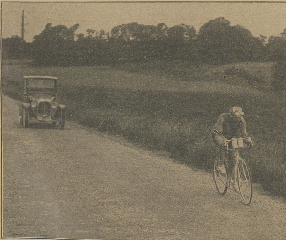
Henry Pelissier, znakomity kolarz francuski, prowadzi bieg Tour de France w pierwszym etapie.