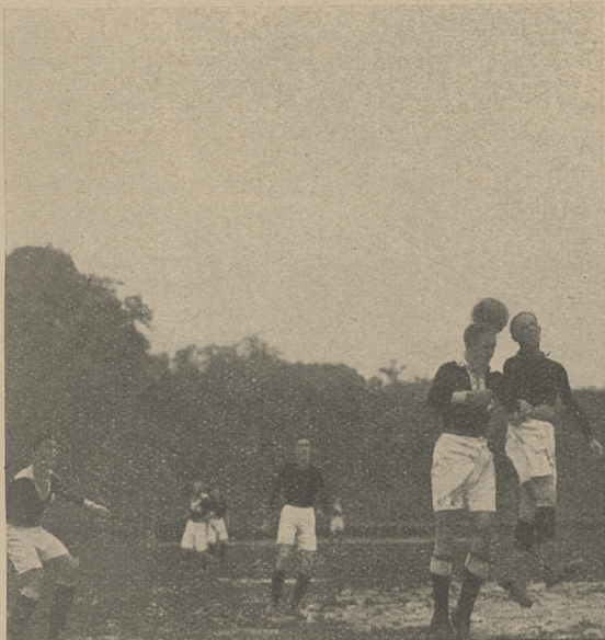
Loth I w walce ze śr. nastpniakiem gości.