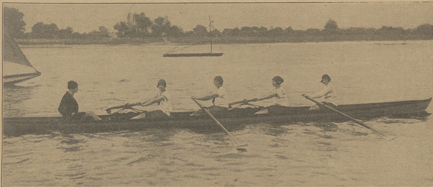
Osada Klubu Warszawskich Wioślarek podczas treningu.

REDAKCJA I ADMINISTRACJA WARSZAWA, ZGODA 12. TELEFON 122-14.