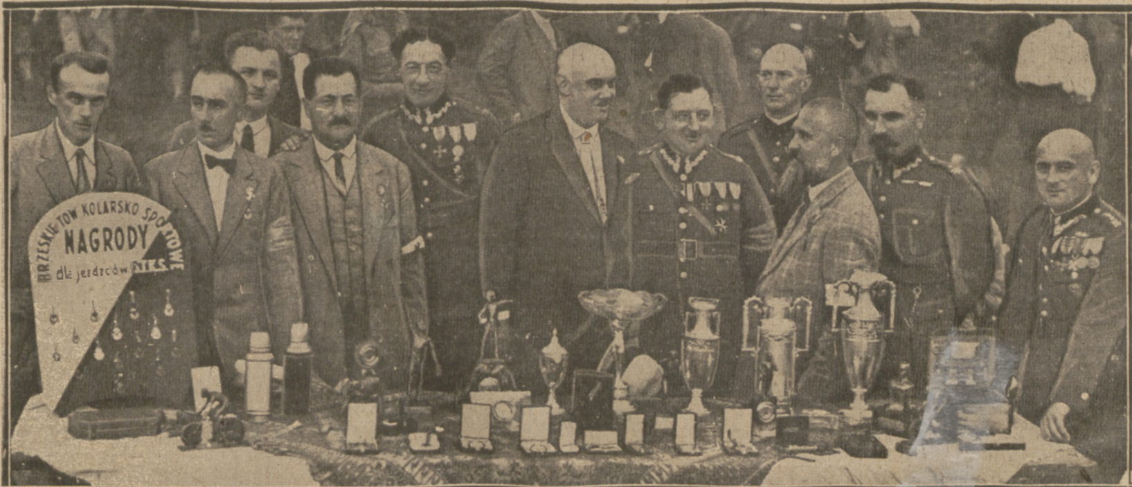
NAGRODY, KTÓRYCH NIE ZDOBYTO

stawiła zacięty opór Helenie Wills podczas meczu Anglia — Ameryka.