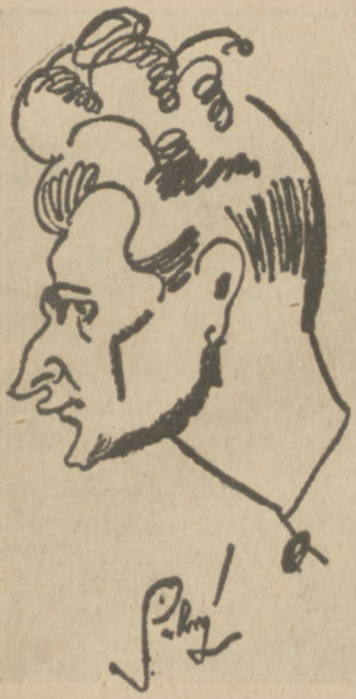
SILNY Drużyna reprezentacji piłkarskiej Czechosłowacji.