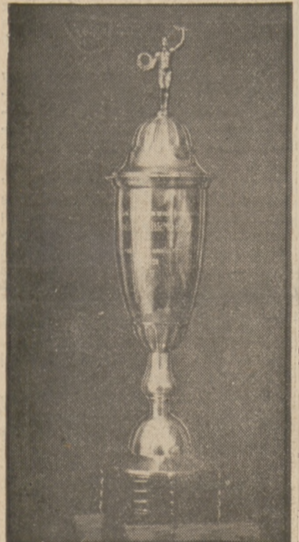
PUHAR BRNA o którego ponowne zdobycie walczyć będą łodzianie.

LWÓW, 15.10. — (Tel. wł.). W zawodach o wejście do Ligi lwowskiej drugi Sokół pokonał rezerwę Pogoni 3:2, Pogoń Stryjska zwyciężyła Hasmonę 1:0, a Ognisko Jarosławskie wygrało ze Stanisławską Rewera 3:2.