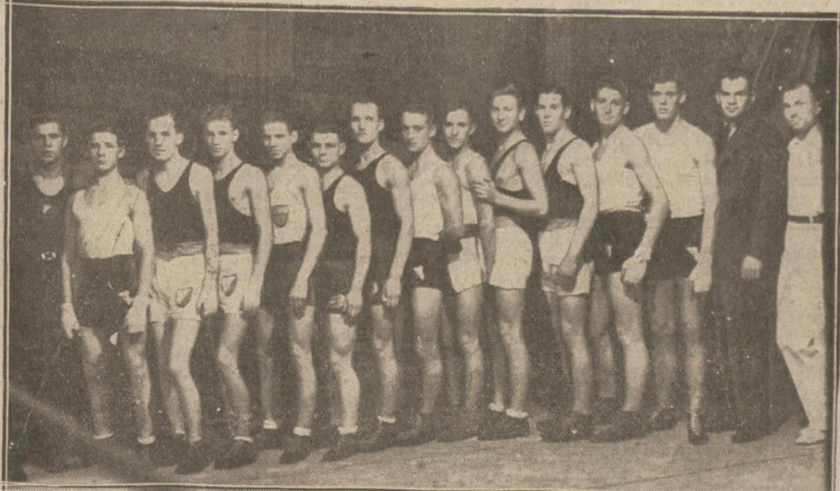
FINALIŚCI PIERWSZEGO ROKU BOKSERSKIEGO W WARSZAWIE Puchar przechodni P. U. W. F. zdobyła drużyna Polonii.

W ogólnej punktacji Polonia zdobyła pierwsze miejsce i puchar przechodni P. U. W. F.