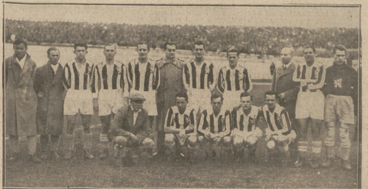
NAJLEPSZA JEDENASTKA PIŁKARZY ZAWODOWYCH CZECHOSŁOWACJI która w meczu eliminacyjnym o mistrzostwo świata pokonała Polskę 2:1, na stadionie Wojska Polskiego w Warszawie.