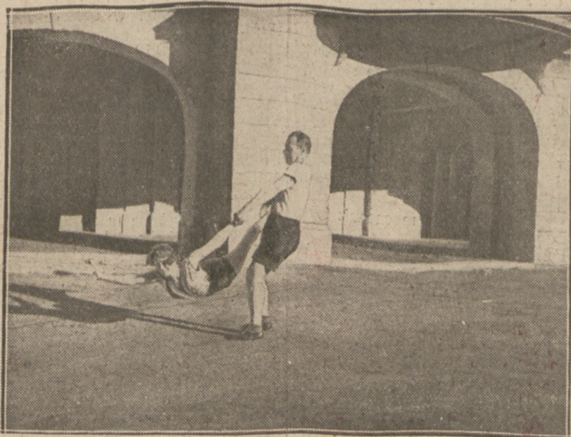
ZAPRAWA MISTRZÓW JAZDY FIGUROWEJ