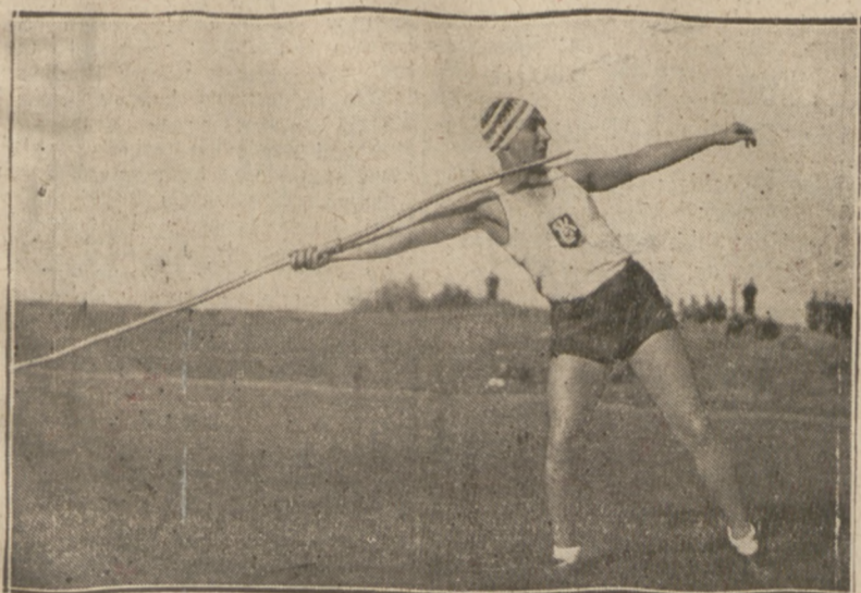
NOWA POLSKA REKORDZISTKA ŚWIATA

mimo swych 36 lat i dorywczego prawie uprawiania tenisu, pozostał nadal wielkim asem. Dowód — dwie kolejne porażki zadane przez Francuza Austinowi, sklasyfikowanemu wszak na 4-tym miejscu listy światowej.