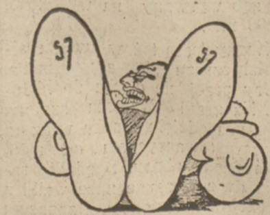
STOPY CARNERY w karykaturze niemieckiej.

A tymczasem na autostradzie nie jeden wóz przemknął się z niedozwoloną szybkością. G.