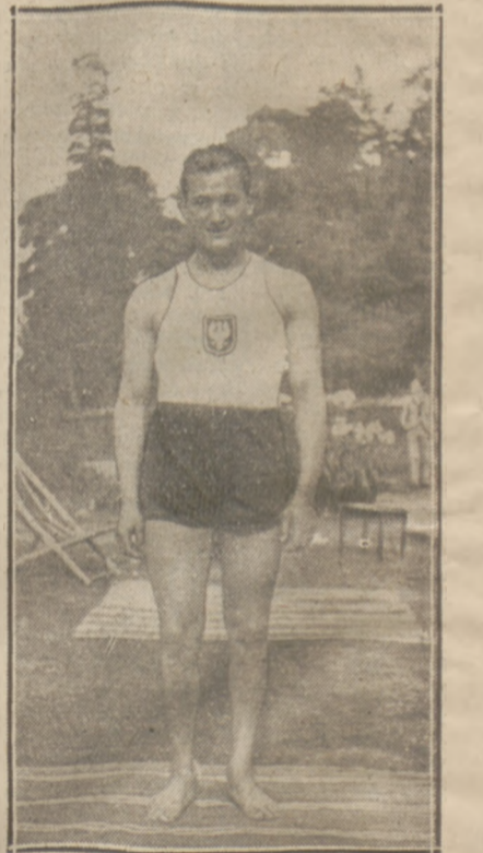
HELJASZ już drugi rok zrzędu jest „wicekrólem” kuli w Europie.