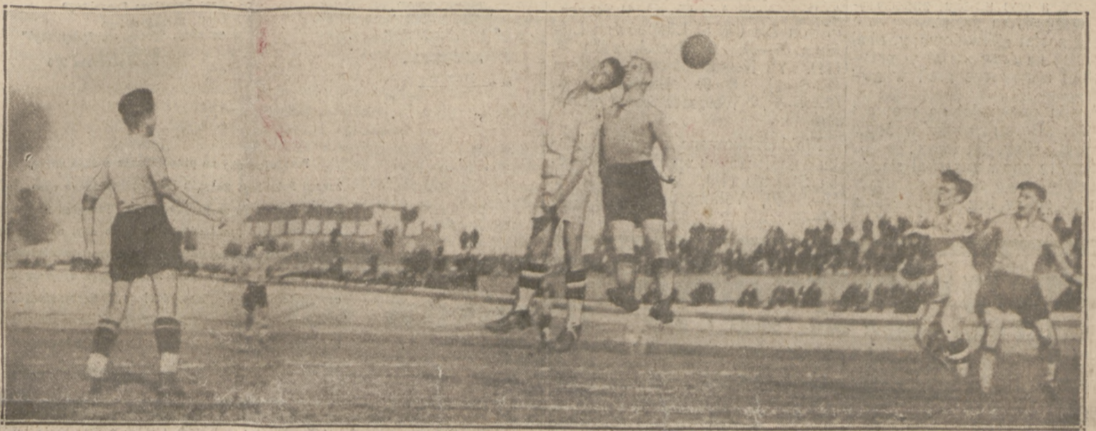
CIĘKAWY POJEDYNEK GŁÓWKOWY