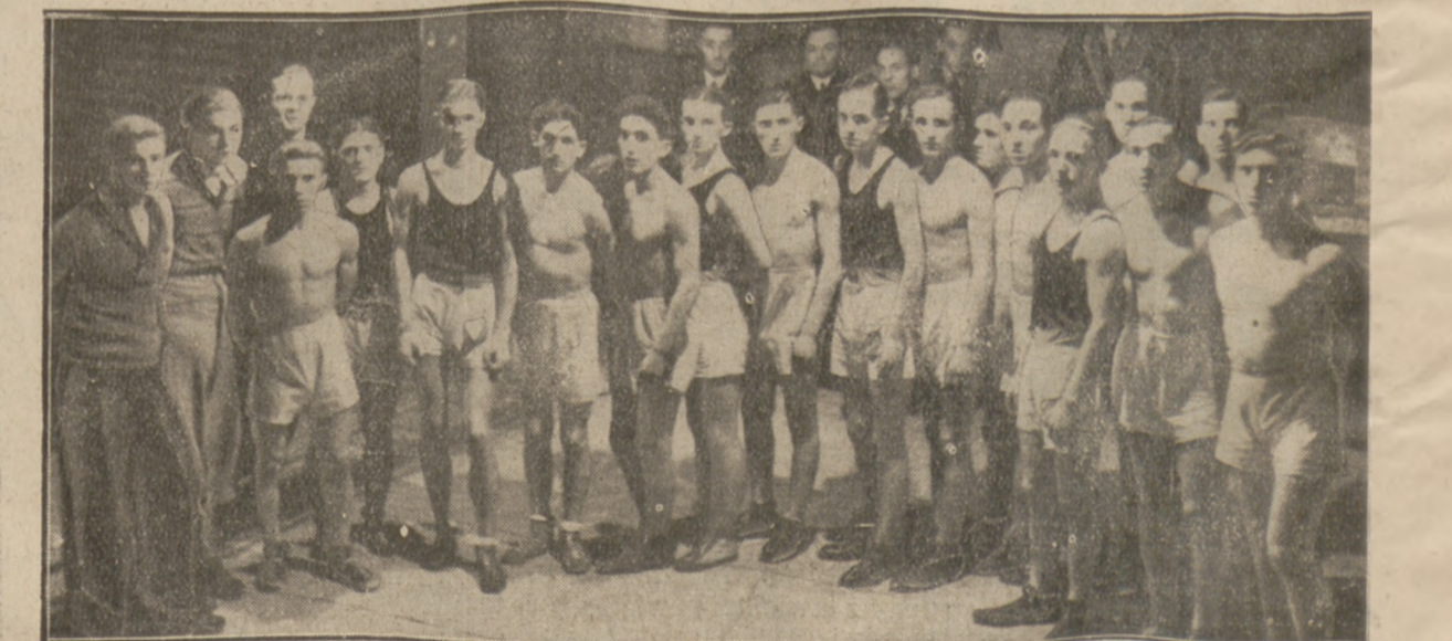
GRUPA UCZESTNIKÓW MECZU BOKSERSKIEGO POLO NIA — MAKABI 11:5

Prenumerata kwartalna zł. 7. Cena ogłoszeń: za wiersz wysokości 1 mm. szerokości szpalty red. w tekście zł. 0.80 poza tekstem zł. 0.40.