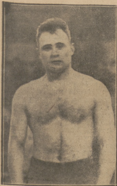
ROSLAW (IKP) zjawiał się znów w ringu i zdemontrował wcale dobrą formę wygrywając na meczu z Makabi ze Steineisenem.