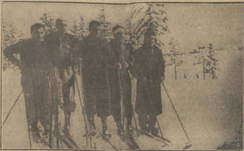
TRENER WŚÓD PUPILKÓW

Co jest powodem takiej zmiany pu- bliczności trudno dociec.