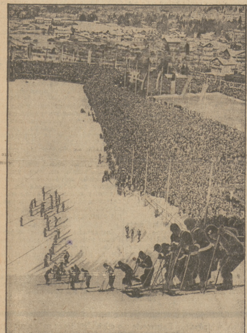
OLIMPIJSKI KONKURS SKOKÓW Morze głów otacza s kocznie w Garmisch.