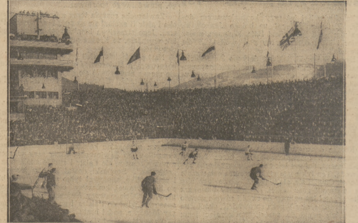
OGÓLNY RZUT OKA NA MECZ KANADA — AMERYKA 1:0 który rozstrzygnął o pierwszym miejscu Anglii w turnieju olimpijskim.