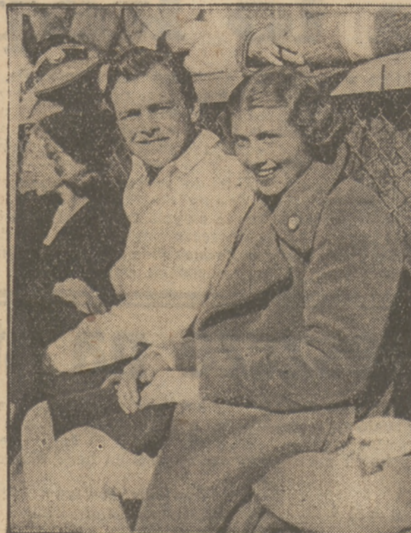
ANGIELKA COLLEDGE, najgroźniejsza rywalka Soni Henie, patrzy z trubuny na popisy norweskiej mistrzyni świata.