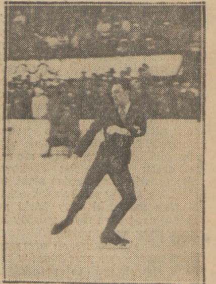
KAROL SCHAFER nowtórny mistrz olimpijski.