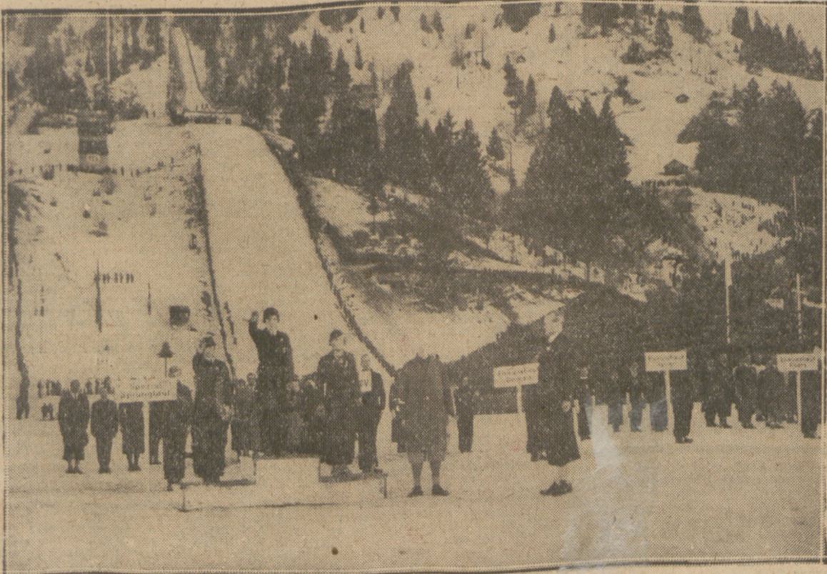
FANFARY OLIMPIJSKIE WITAJĄ ZWYCIĘZCÓW

Na podwyższeniach stoją triumfatorzy kombinacji alpejskiej: Christ Cranz (Niemcy), Käthe Grasseger (Niemcy) i Schon Nilsen (Norwegia).