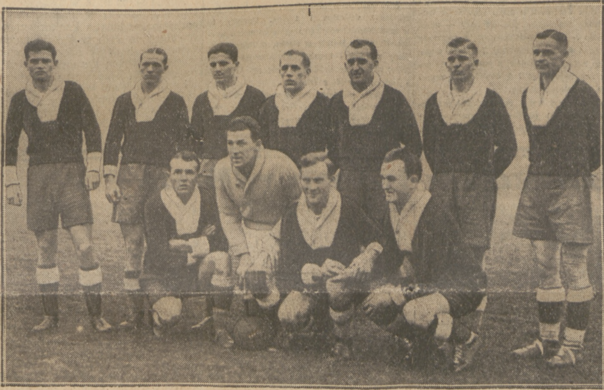
TEAM POLSKI, KTÓRY POKONAŁ BELGJE W BRUKSELI 2:0