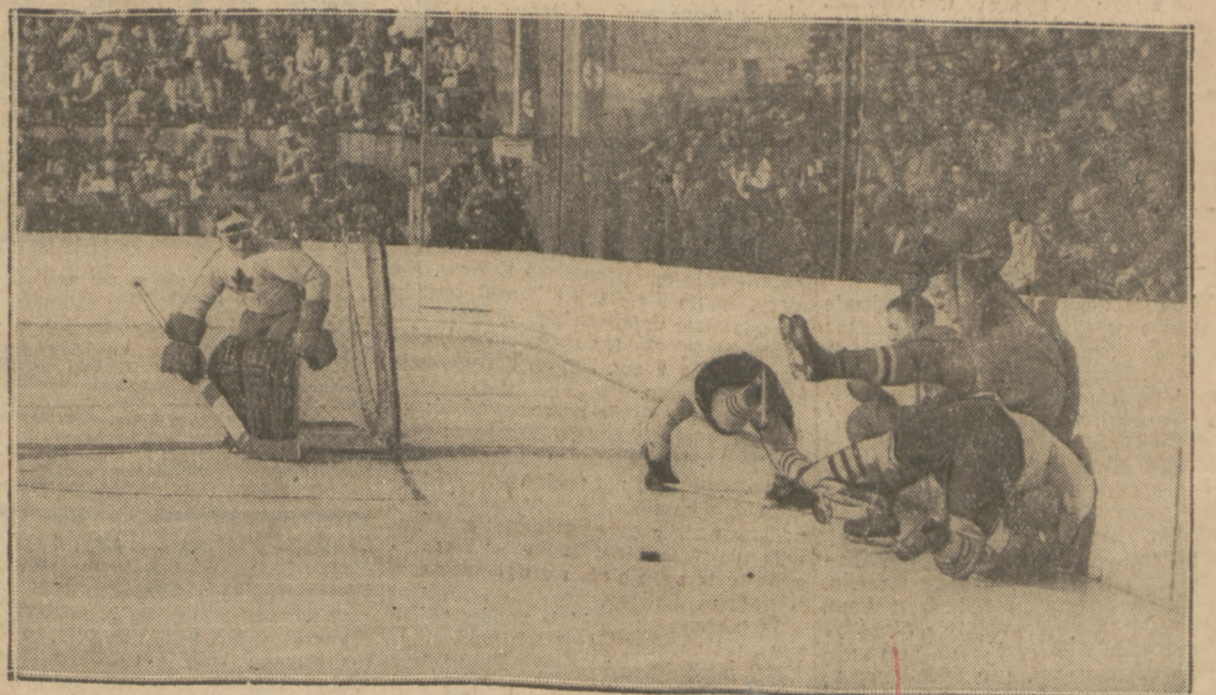
PRAWDZIWIE „KANADYJSKI” MOMENT podczas meczu finałowego w Garmisch.

Na podwyższeniach stoją triumfatorzy kombinacji alpejskiej: Christ Cranz (Niemcy), Käthe Grasseger (Niemcy) i Schon Nilsen (Norwegia).