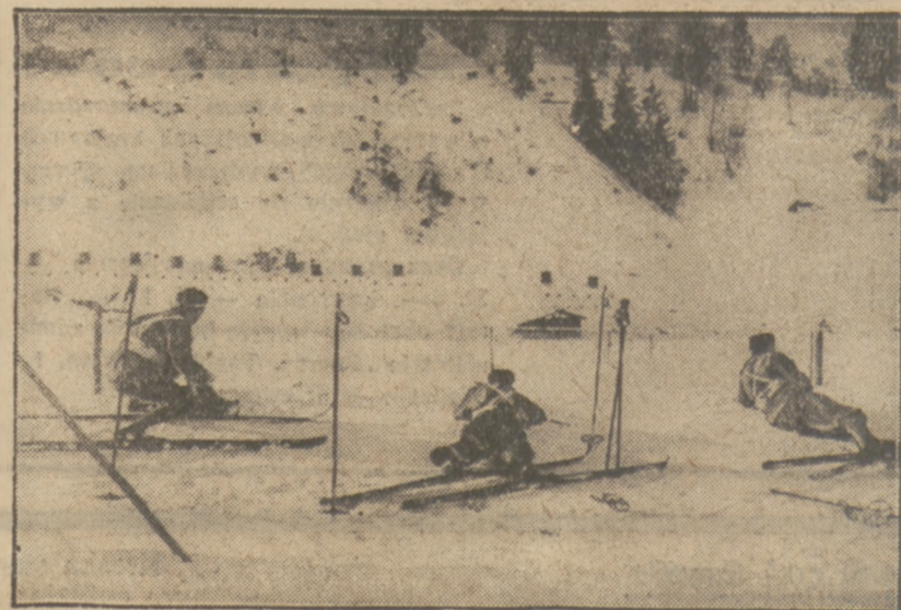
PATROL WŁOSKI STRZELA podczas swego zwycięskiego biegu w Garmisch.