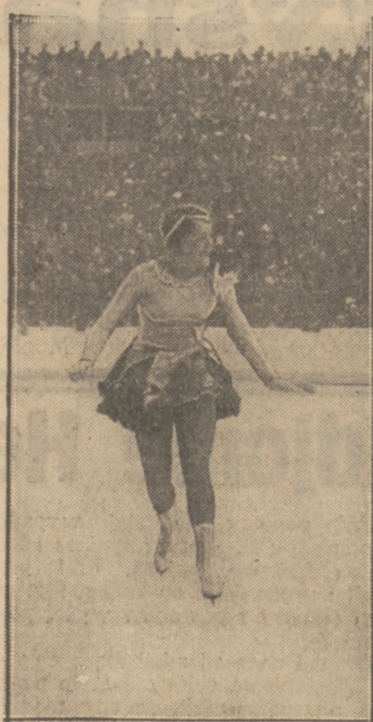
SONIA HENIE znów zdystansowała rywalki olimpijskie.

Porównując rekordy lyżwiarzy z rekordami lekkoatletycznymi dochodzimy do ciekawych wniosków. Na dystansie 500 m. może lyżwiarz dać kolede swe m. z bieżni wrywaniem 1500 m. około 600 m., na 5000 m. — 2000 m., a na 10.000 m. — 4.000 mtr.