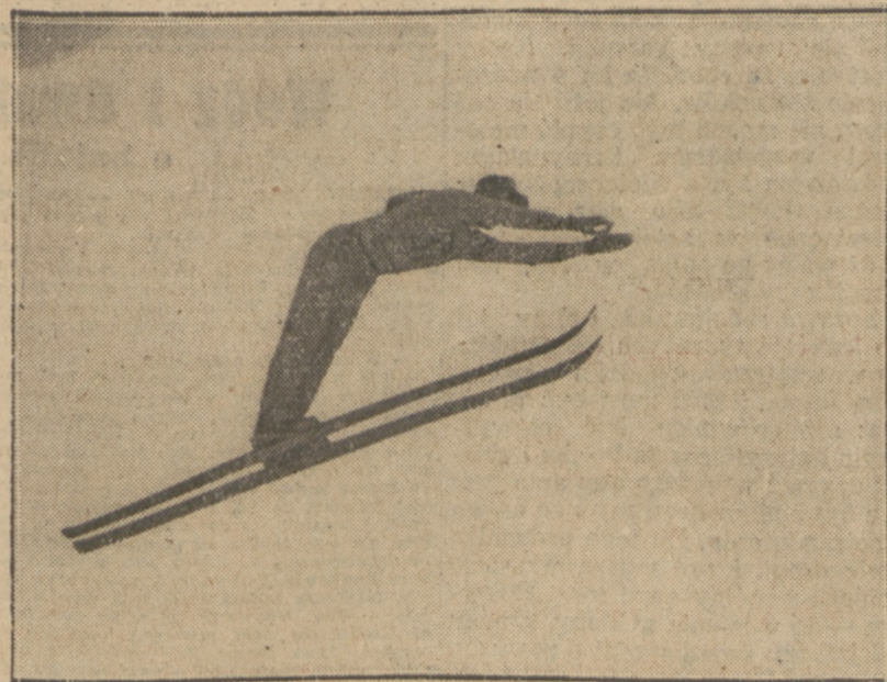
KLASYCZNY SKOK SZWEDA ERIKSSONA