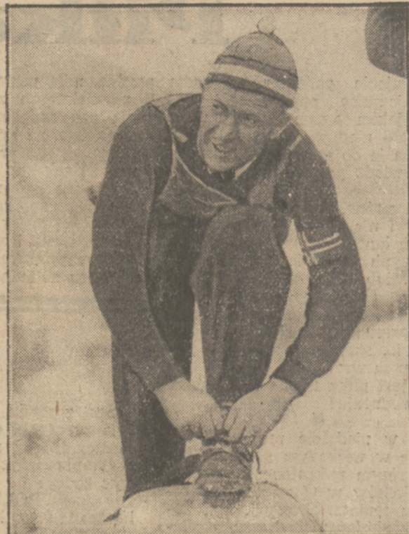
BIRGER RUUD najlepszy skoczek świata, szykuje się do konkursu w którym zdobędzie laur olimpijski.