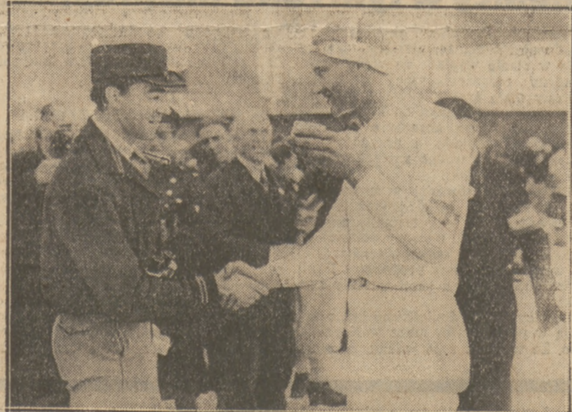
KRÓLEWSKA GRATULACJA Następca tronu Szwecji, ks. Gustaw Adolf, wita triumfatora maratonu olimpijskiego — Viklundą.