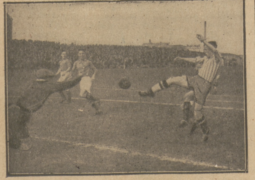
WILIMOWSKI STRZELA prosto w ręce szczęśliwemu bramkarzowi Schacherowi na meczu Ruch — Sportreunde 2:2 w Halle.