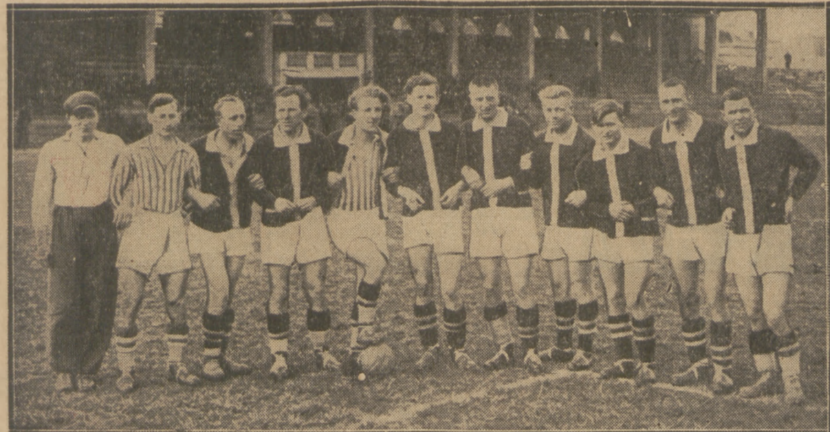
PIŁKARZE OSTROVII (Z OSTROWA WLKP.)

PRZEGLĄDU SPORTOWEGO ukaże się nie w czwartek, lecz w piątek 17-go b. m.