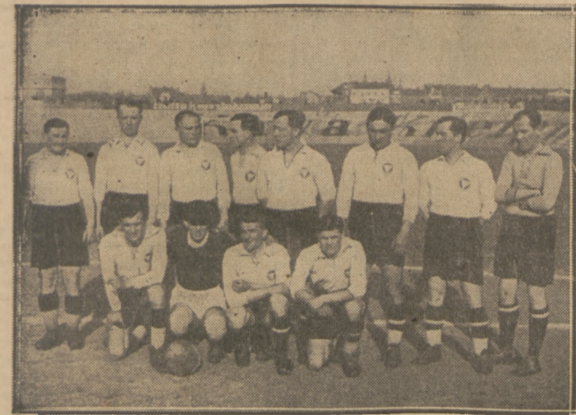
LIGOWY ZESPÓŁ GARBARNI

Bukareszt: Oradea Mare — Slavia (Praga) 2:0.