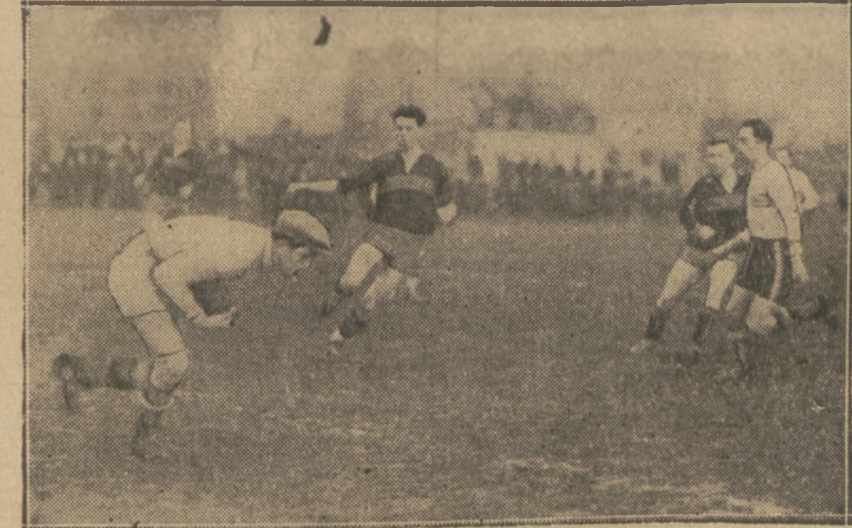
GWIAZDA (WARSZAWA) — MAKABI (ŁÓDŹ) 3:1 Bramkarz łódzian w akcji.