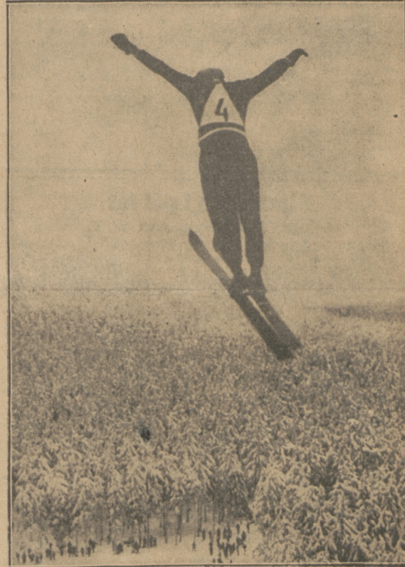
PIERWSZE SKOKI w górach Harzu

stwarzać w tych Okręgach Podokręgi rozgrywkowe.