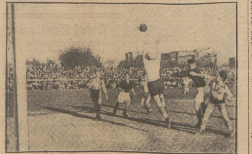
GROŹNA SYTUACJA pod bramką Brygady na meczu z Polonią 4:1.

osiągnął najlepszy wynik zawodów warszawskich, rzucając oszczepem 71,05 mtr.