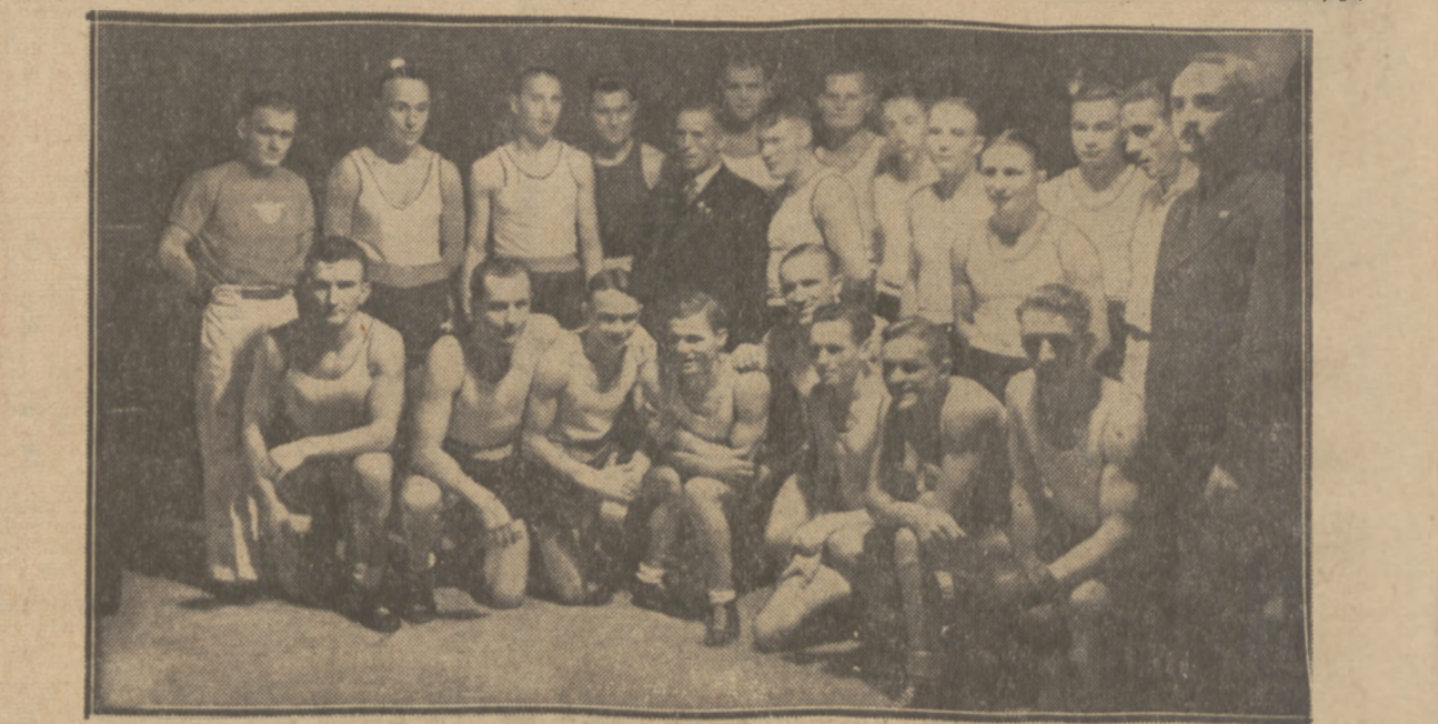
BOKSERZY HEROSU (ERFURT) I SOKOLA (POZNAŃ) zntierzyli się w Poznaniu, przyczym zwyciężyli Polacy.