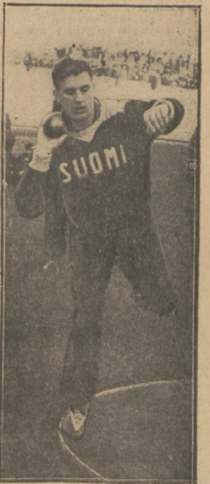
BAERLUND (Finlandia) podczas rzutu kulą na sobotnich zawodach Warszawianki

P. F. Zaw., Łódź. Uwagi Pana podane są w tonie, który wyklucza poważne ich traktowanie. Można mieć różne zdania, ale to nie upoważnia do drwin.