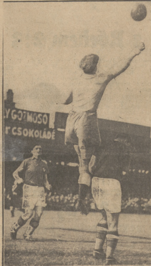
TAK GRA GLAZER znakomity bramkarz jugosłowiański.