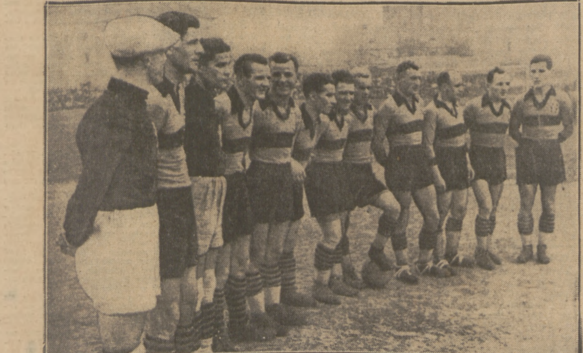
SMIGŁY — PO 7 LATACH WALKI — WSZEDŁ DO LIGI Płakarze wileńscy dzięki wysokiemu zwycięstwu nad Unią 8:1. zdobyli miejsce w extra klasie.

ale nie. Tym razem atakuje biegacz zadany rehabilitacji, który czuje, że przyszła jego chwila, że może sobie na to pozwolić naprawdę. Soldan wychodzi na trzecie miejsce i utrzymuje się na nim przez okrążenie, by zgotować jeszcze większą niespodziankę. W szóstej rundzie Soldan wysuwa się na czoło przed Lehtinena, Mosterta, Noji i Hoppania. Tempo 1:09.6.