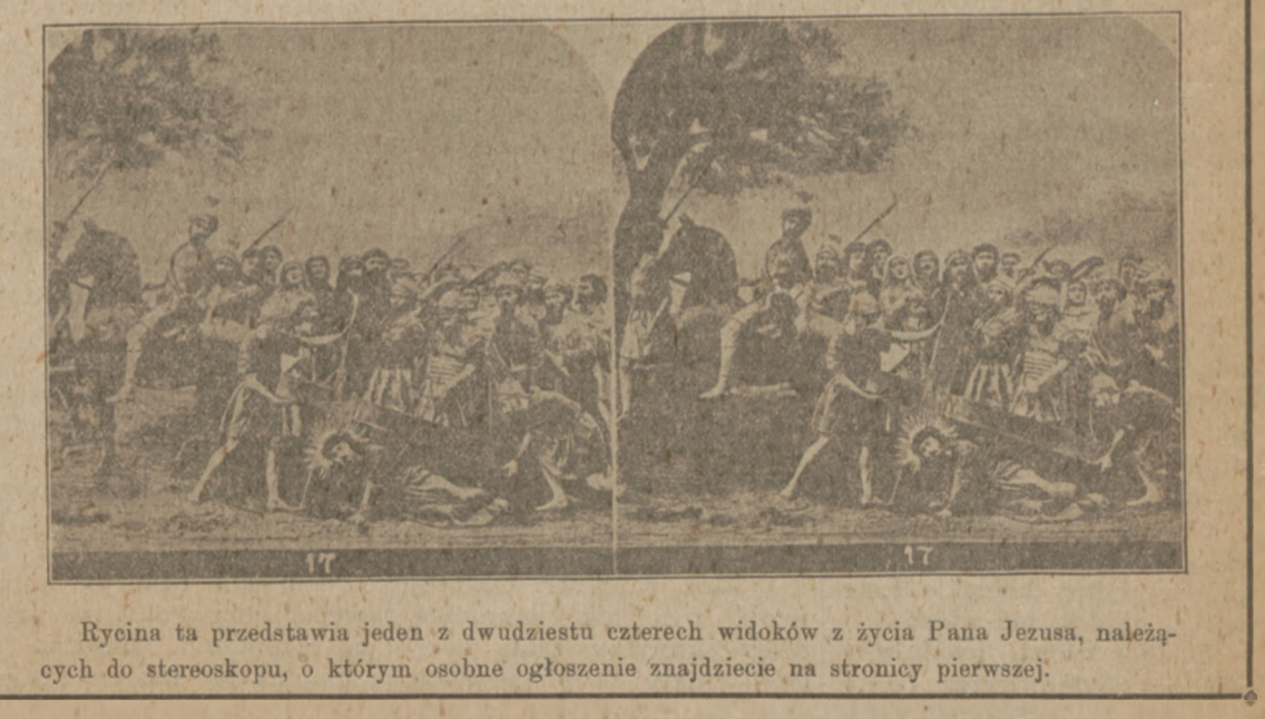
Rycina ta przedstawia jeden z dwudziestu czterech widoków z życia Pana Jezusa, należą-cych do stereoskopu, o którym osobne ogłoszenie znajdziecie na stronie pierwszej.

Mamy przed sobą numer nowego pisma, wychodzącego w Krakowie pod tytułem "Ilustracja Polska." Pismo to oszobione listami ryoi-nami i barwnie pisanemi artyku-łami, przedstawia się bardzo pięknie. Wychodzi w każdy piątek. Cena numeru wynosi 80 hal., kwartalnie kosztuje $1.00. Adres: Ilustracja Polska, Kraków, Rada-wiłowicka 8.