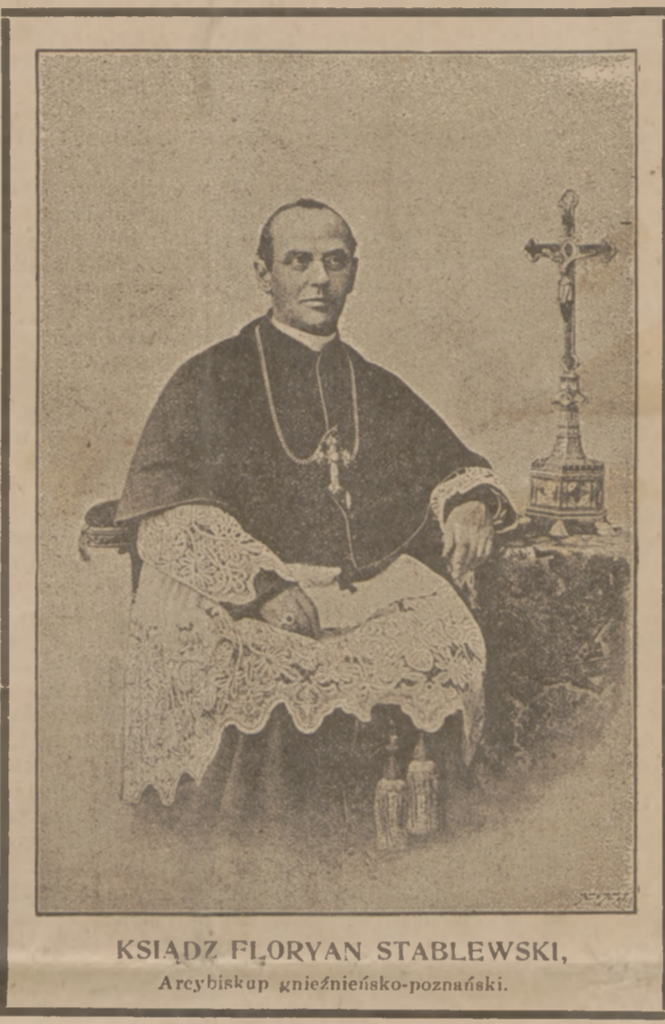
KSIAZDZ FLORYAN STABLEWSKI, Arcybiskup gnieźnieńsko-poznański.

Pisząc o przesładowaniu dzieci polskich, H. Sienkiewicz powiada: Prześladowanie dzieci polskich w szkołach pruskich staje się coraz większym z każdym rokiem, a kara cięlesna coraz częściej bywa stosowana w szkole. Nadużywanie chłosty w szkole