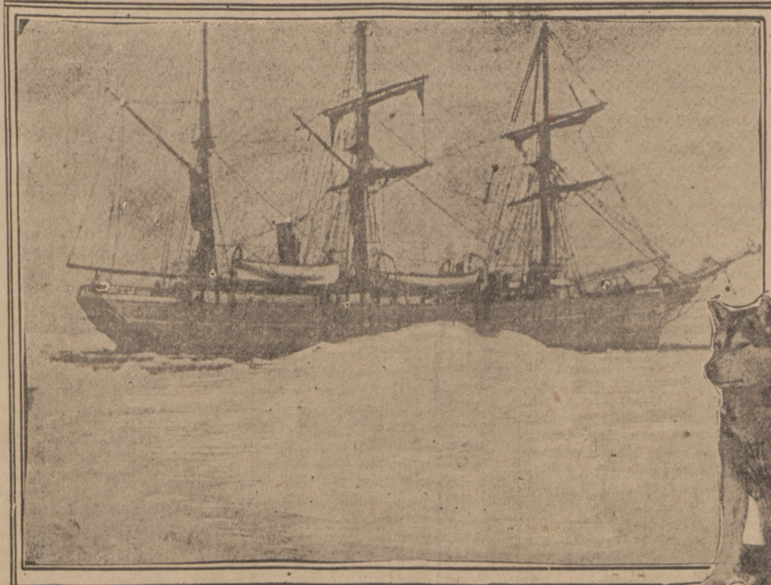
The John R. Bradley