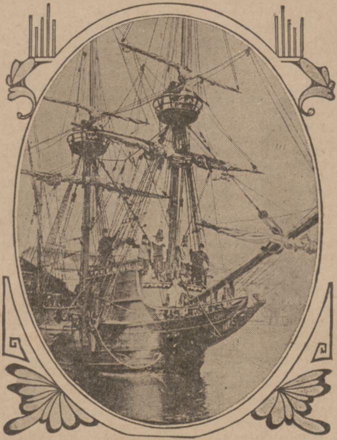
Hudson'a żaglowiec "Half Moon" który bierze udział w wielkiej wodnej paradzie w Stanie New York.