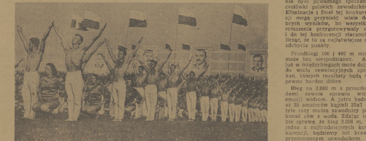
Gimnastyki w czasie pokazu wykpił wspaniale. Oto fragment jednego z niezwykle efektownych ćwiczeń.

Pierwszy dzień Spartakiady lekkoatletycznej zapowiada się więc bardzo interesująco. (B. Ma.)