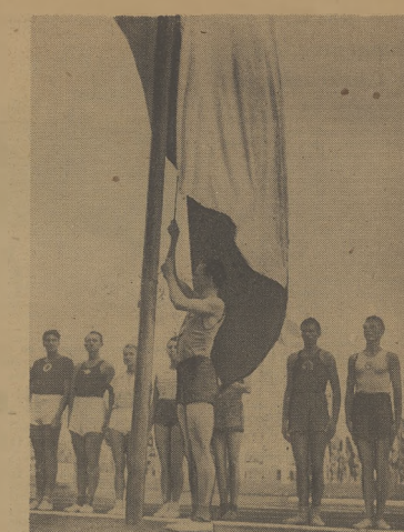
Ogromną flagę o barwach narodowych wciągnął na maszt mistrza Polski, Mach.

Poszczególne ćwiczenia były trudne, a wykonanie ich stało na wysokim poziomie. Należektownie wypadły ćwiczenia rozwierające element wagi. Po ćwiczeniach gimnastycznych, kierowani przez Radziejewskiego ze specjalnie zbudowanej wieżycy ustawili