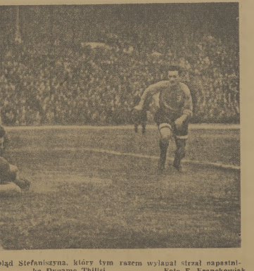
Gagnide w oczekiwaniu na bład Stefaniusza, który tym razem wygrał strzał napastnika Dynamo Thibisi.

Kurs trenerów piłkarskich rozpoczął się w dniach obecnym w Warszawie w czwartek, 8 listopada. Dla mierzadki zaczął się on w miejscu pierwszego treningu piłkarski Dynamo, a więc o dwa tygodnie wcześniej. Mgr. Jesionka na każdym treningu grał z piłkarzami, którzy przyszedłszy do klubu, wyczerpani z poprzedniego treningu, wyjmowali szaty i odłówek i pozostawiali w szatni, a następnie wstępowali na boisko. W tym czasie trenerzy piłkarscy pracowali z piłkarzami, którzy przyszedłszy do klubu, wyczerpani z poprzedniego treningu, wyjmowali szaty i odłówek i pozostawiali w szatni, a następnie wstępowali na boisko. W tym czasie trenerzy piłkarscy pracowali z piłkarzami, którzy przyszedłszy do klubu, wyczerpani z poprzedniego treningu, wyjmowali szaty i odłówek i pozostawiali w szatni, a następnie wstępowali na boisko.