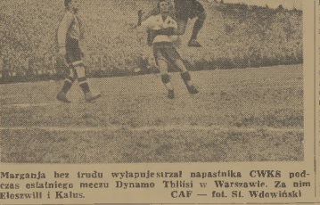
Margaja bez trudu wypanierował napastnika CWKS podczas ostatniego meczu Dynamu Thibisi w Warszawie. Za nim Klezwali i Kalas.

Przygotowanie gimnastyczne zaczyna się oczywiście w szkole, ale to jest dopiero początek. Właściwa gimnastyka — to która w dzieleniu na boisku zaczęła się w zimie przed kilkoma dniami, pod kierunkiem specjalnego trenera — gimnastyki.