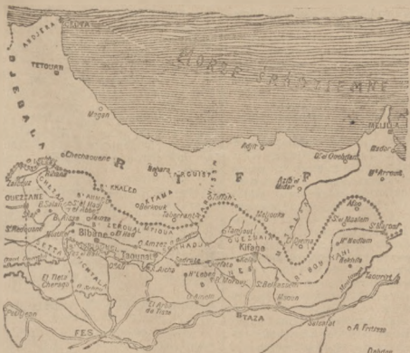
Pole walki w Marokku.