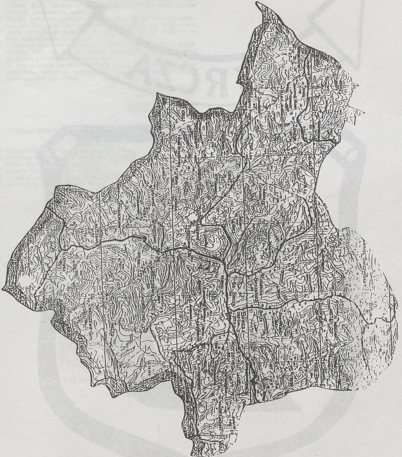
Mapa poglądowa Gminy Bircza