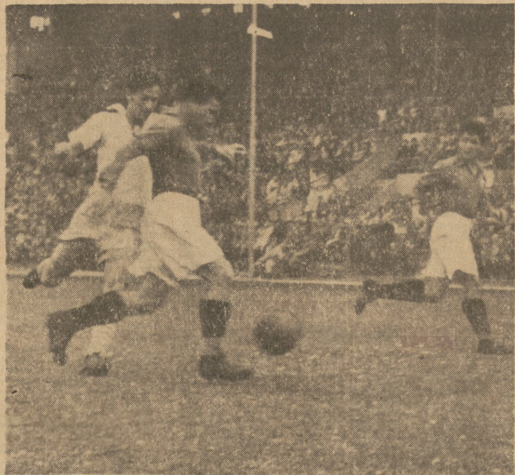
Krasowka, który po przerwie zastąpił Jaśkowskiego na prawym łączniku, nie odbierze tej piłki Bułgarom.