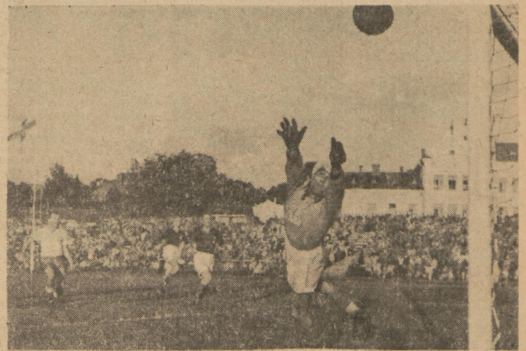
Tak padła pierwsza bramka na meczu Polska — Francja rozegranym w Łodzi