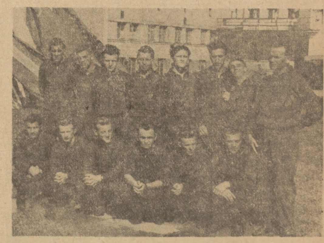
Zdobywca piłkarskiego Pucharu Złoty, drużyna krakowskiego OWKS.

Częściej niż zwykle odbywały się w niedzielę fanfary przy wejściu do Agrikoli, więc miały roboty w tym dniu przemienić w swej powadze, warty harcerskie, zdurujące w wejściu do miasteczka.