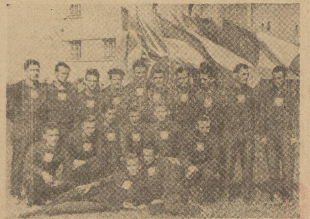
Drużyna piłkarska Orła, która zremisowała z wiedeńskim zespołem FAC 1:1

W drużynie węgierskiej obok Puskasa i Grositsa wyróżnił się również Bużansky na obronie. Słabiej niż zwykle zagrali skrzy- dłowi Judai i Hidegkuti. W drużynie włoskiej najlepiej byli obaj pomocnicy Venturi i Neri. Bramki padły w kolejności: 10 min. — Palotas, 20 min. — Palotas i 89 min. — Puskas. Węgry grali w składzie: Gros- its, Bużansky, Lorant, Lantos, Zaharias, Bozsik, Judai, Kocsis, Palotas, Puskas, Hidegkuti.