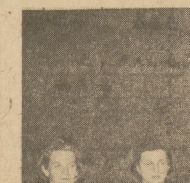
Kobiecej reprezentacji CSR w gimnastyce.

Te sukcesy sprawiły, że tegoroczne Igrzyska stały się dla gimnastyki sportowej momentem przełomowym. Wprawdzie