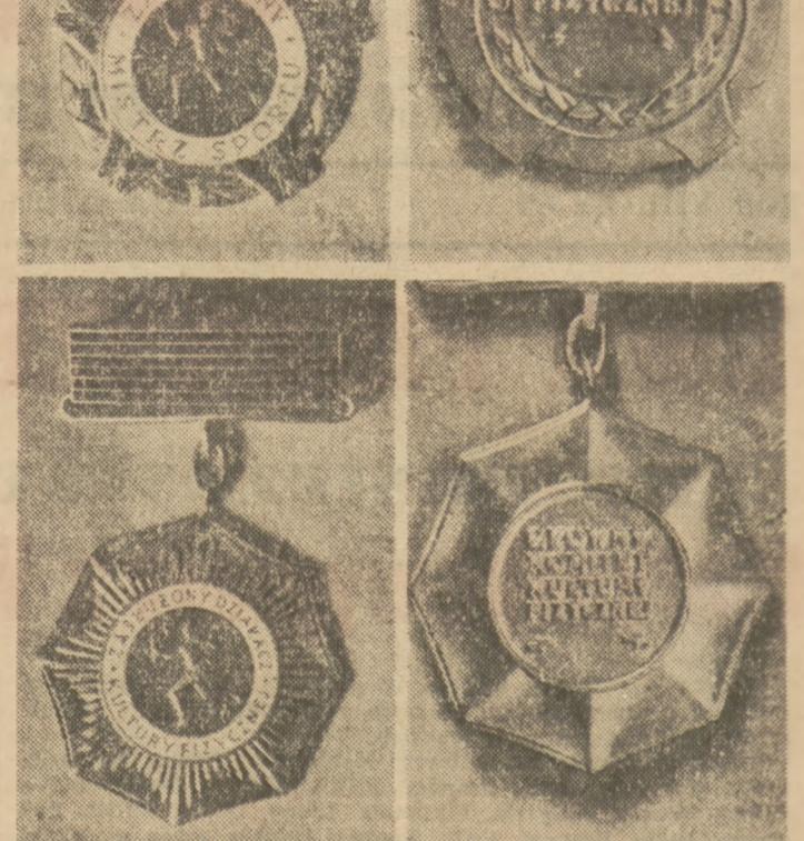
Główny Komitet Kultury Fizycznej ustanowił odznaczenia i tymczasowe legitymacje dla „Zasłużonego Mistrza Sportu” i „Zasłużonego Działacza Kultury Fizycznej”.

Odznaczenie „Zasłużony Mistrz Sportu” wykonane jest w formie orderu z baretką emalowaną w kolorach biało-czerwono-srebrno-żółtych.