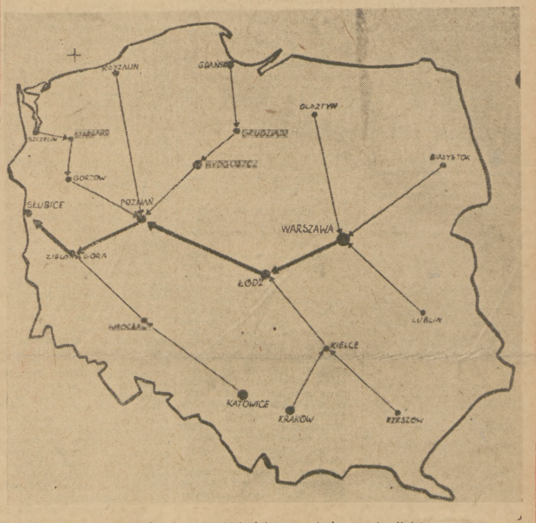
Trasy sztafet wojewódzkich i trasa centralna (gruba linia).

SZTAFETA wyruszy z gmin i zdać będzie poprzez powiaty do województwa, a następnie trasą główną z Warszawy, poprzez Łódź, Poznań, Zieloną Górę do granicy NRD. Tutaj, na granicy przesyłki młodzieży polskiej przekaże pozdrowienia i meldunki dla Kongresu Narodów — młodzieży FDJ. Nasz przysłać z tamtej strony Odry poniesie te meldunki i pozdrowienia przez Niemiecką Republikę Demokratyczną — do granicy Austrii.