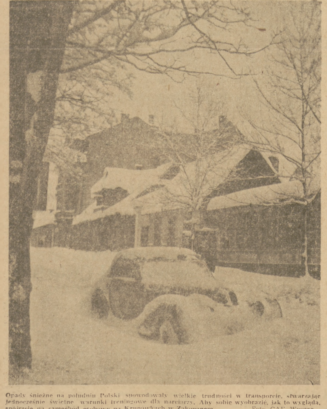
Opady śnieżne na południu Polski spowodowały wielkie trudności w transporcie, stwarzając jednocześnie świetne warunki treningowe dla narciarzy. Aby sobie wyobrazić, jak to wygląda, spojrzcie na samochód osobowy na Krupówkach w Zakopanem.

Smutne będzie jednak spotkanie czołowej zawodniczek. Ci, którzy w ub. sezonie na zimowych Igrzyskach Olimpijskich w Oslo zdobywali dla Austrii medale i postawili Austrię na czele nocy narciarskich, tj. Praxda, Schneider, i Spiss, ci najlepsi z najlepszych nie będą już w bieżącym sezonie startować w barwach Austrii. Wszyscy trzej dali się skusić propozycją z Ameryki, gdzie przebywa już wielu czołowych narci-