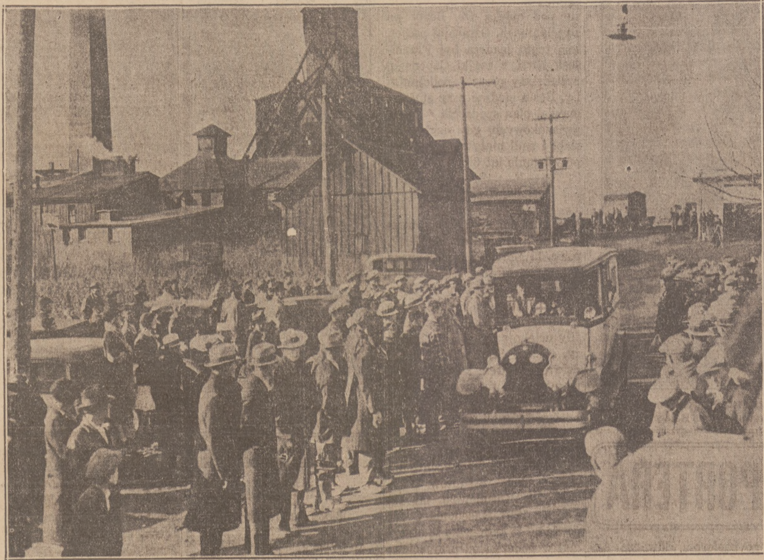
Ogólny widok zrybu kopalni węgla w Moweaqua, Ill., gdzie eksplozja gazów pogrzebała 54 górników w wigilię Bożego Narodzenia. Na ilustracji ambulans zabiera zwłoki jednej z nieszczęśliwych ofiar katastrofy.