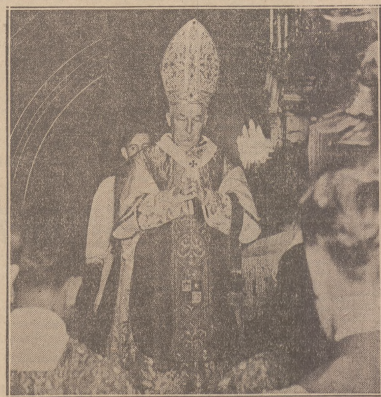
J. E. X. Kardynał J. Mundelein podczas Mszy Pontyfikalnej, odprawionej w katedrze Najświętszego Imienia w pierwsze święto Bożego Narodzenia.