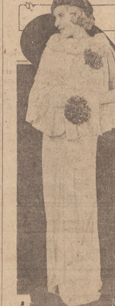
Aksamit, krepa, fiołki, są bardzo używane w tym sezonie w toaletach słuhych. Na rycinie, dwa malownicze kostiumy: z lewej, toleta "damej honorowej" z białej krepy z perłową i żarławką z błękitu, również ubranie fiołkami.