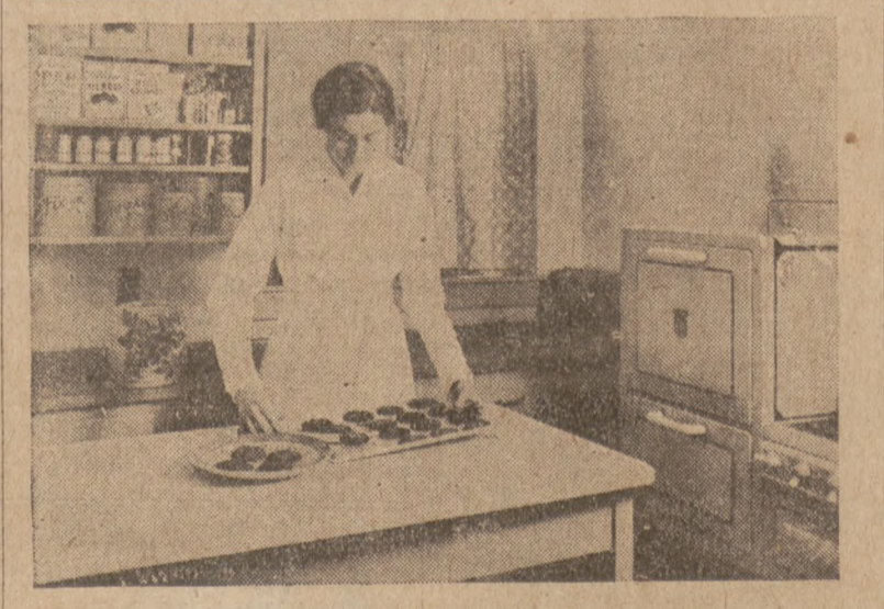
Pisze Jane Rogers

OTREBY, powłoka zewnętrzna ziarnka pszenicznego i jedynego z najstarszych pokarmów ludzkości, od dawnych lat uznane są za zdrowotny pokarm. Nauka dopiero ostatnio odkryła, dlaczego otręby są jedynym z najcenniejszych pokarmów w naszej diecie. Świerdzeniem zostało, że oprócz tego, iż są ważnym źródłem włókna czyli szorstkiej masy, która jest potrzebna do utrzymania kiszki w należytym działaniu, otręby zawierają w znacznej ilości żelazo i witaminę B. Żelazo zawarte jest w formie, która jest łatwo przyswajana przez organizm dla wyrobienia zdrowej, czerwonej krwi. Witamina B przyczynia się do zdrowia przez wzmożenie przewodzenia trawiennego i ustroju nerwowego. Aczkolwiek ten aprobowany przez naukę pokarm dokonywa wzrost ciał w naszym ciele, to znajdujemy go w niektórych najsłynniejszych potrawach. Zawsze popularny garnek z ciastkami staje się źródłem zdrowia. Kiedy jest wypieczony wybornymi ciastkami, przyrządzonymi według tego wyrobionego przepisu: