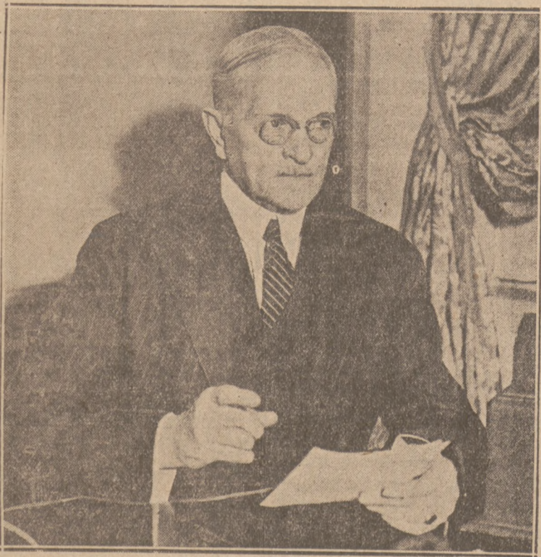
Gen. John J. Pershing, który w drodze do Arizony zachorował w Midland, Tex., na zapalenie gardła i oskrzeli, ma się już lepiej i za parę dni uda się w dalszą drogę do Tucson, Ariz.