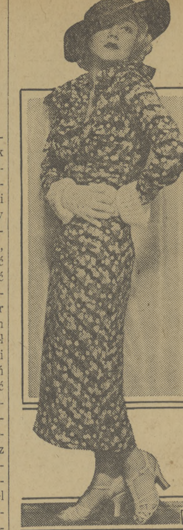
Sukienka ta jest zrobiona z no- wego materiału letniego w pięk- nym deseni, której główną deko- racją są kokardy na ramionach.