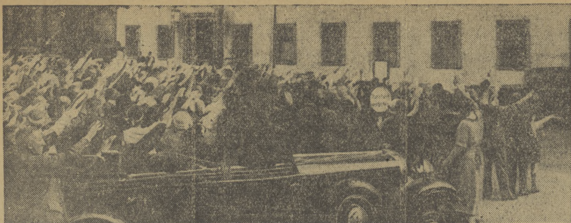
Na drugi dzień po krwawym stłumieniu buntu w szeregach hitlerowskich przez kanclerza Hitlera i jego oddanych adiutantów, grupa hitlerowców zebrała się przed rezydencją Hitlera w Berlinie, aby mu okazać swą lojalność. Widzimy na rycinie hitlerowców, salutujących Hitlerowi, Goeringowi i Goebbelsowi, którzy pokazali się im z okien domu.