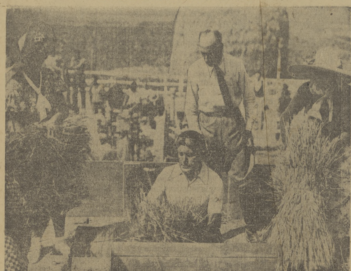
Premier Mussolini, jak widzimy na rysunku, zajęty jest pracą młócenia żyta, zebranego poraz pierwszy z dawnych meczadł w okolicy Pontine...