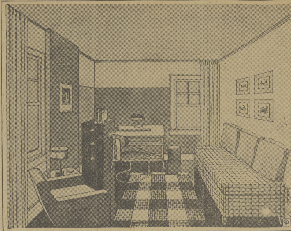
Artysta Werle urządził ze skromnej swej sypialni wygodne studjum, malując ściany na biało, sufit na kremowo, a podłogę na brązowo. Długie perkalowe firanki nadają temu pokojowi wygląd wyższy i piękniejszy. Umeblowanie pomimo, że niekosztowne, jednak dostosowane kombinacją kolorów: białego i brązowego.