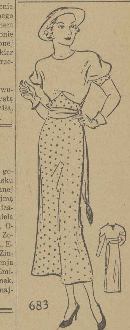
DOBRE ZASTOSOWANIE KONTRAST KOLORÓW. Modelko 683.

Młynek do mięsa, trzepakkę do bicia piany itp. przyrządy kuchenne oliwi się czystą jadal- ną oliwą co jakiś czas, a będą- dłużej służyły.