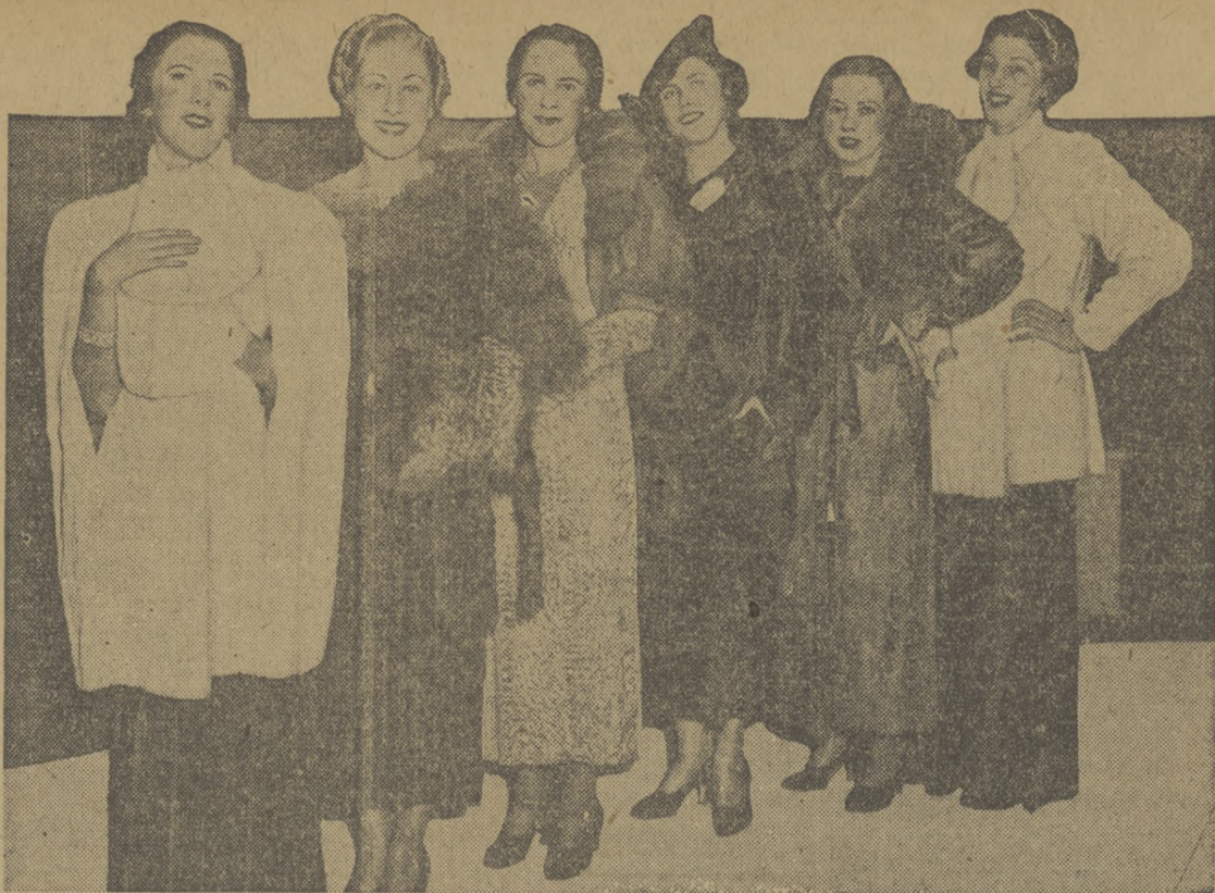
Na rycinie powyższej widzimy najnowsze fasony futrzanych okryć, które wczoraj były z wielkimi powodzeniami prezentowane w Sherman Hotelu przez grono młodych panien.