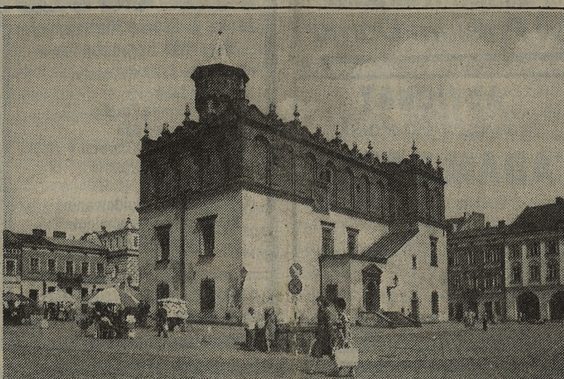
TARNÓW—Rynek—ratusz pierwotnie gotycki, przebudowany w XVI-XVII w.

Strugarki sterowane numerycznie o wartości $17 mln dostarczono do ZSSR w roku 1984, a sprawę tę amerykański wywiad wykrył dopiero pod koniec ubiegłego roku. Od tego czasu Toshiba wstrzymała wszelkie dostawy, a Japończycy pod silnym naciskiem strony amerykańskiej podjęli intensywne śledztwo.