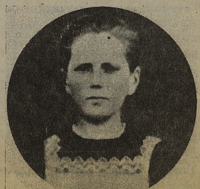
Błogosławiona KAROLINA KÓZKA

"Powszechnie wiadomo — mówił Papież — że wieś polska po dramatycznych doświadczeniach przeżywa kryzys: kryzys moralny i ekonomiczny. Niech wieś podniesie się, uwolni się od obaw i niebezpieczeństw, niech przestanie być jedynie miejscem walki o przetrwanie."