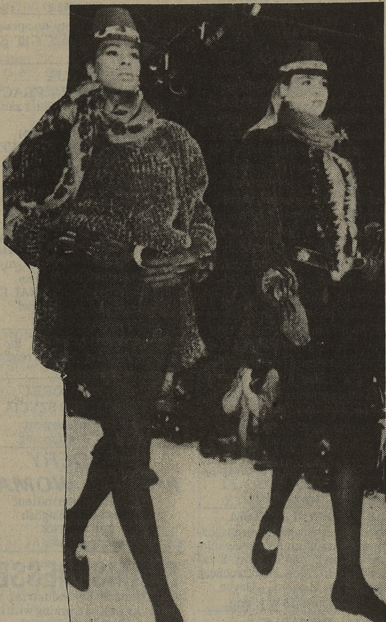
Modele Marc'a Bohana dla Domu Mody Diora. Proszę zwrócić uwagę na długość spodni oraz kapelusze w stylu tyrolskim. (Z pokazów mody jesienno-zimowej w Paryżu).