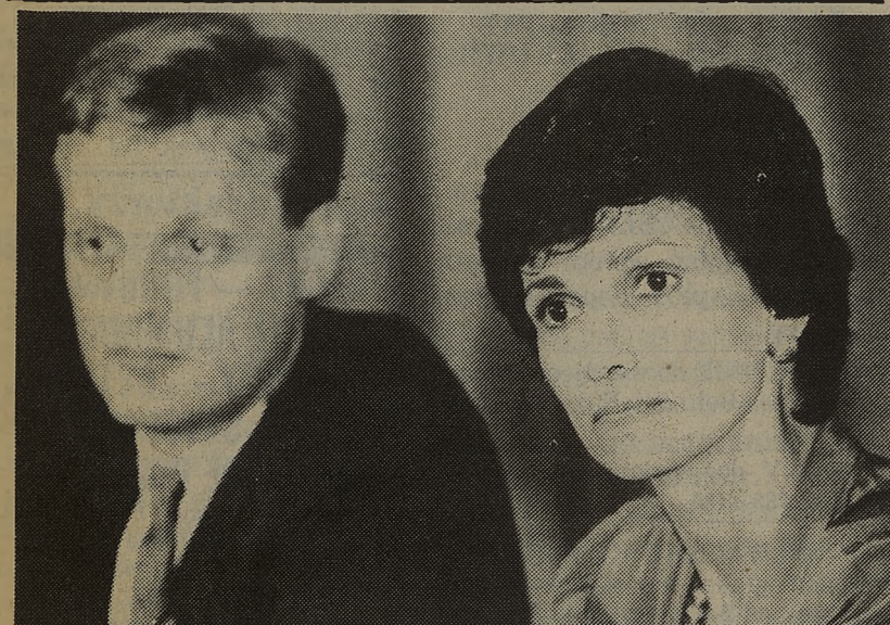
MINNEAPOLIS — Katherine "Kitty" Dukakis, małżonka demokratycznego kandydata na prezydenta Michaela Dukakisa na zorganizowanej konferencji prasowej wyjaśniła, że kiedyś silnie uzależniona była od środków odurzających.