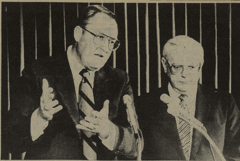
SPRINGFIELD — Gubernator stanu Illinois James Thompson na specjalnie zorganizowanej konferencji prasowej wyraził ubolewanie, iż Legislatura Stanowa nie poparła jego projektu podwyżki podatków. Z prawej, wicegubernator George Ryan.