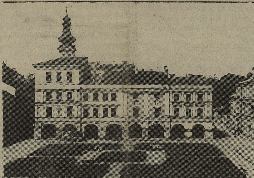
ZAMOŚĆ — Fragment Rynku.

Członkowie Kongresu, którzy udali się do Filadelfii reprezentują 55 delegatów, autorów tekstu Konstytucji. Znajdowali się wśród nich George Washington, Benjamin Franklin i John Madison.