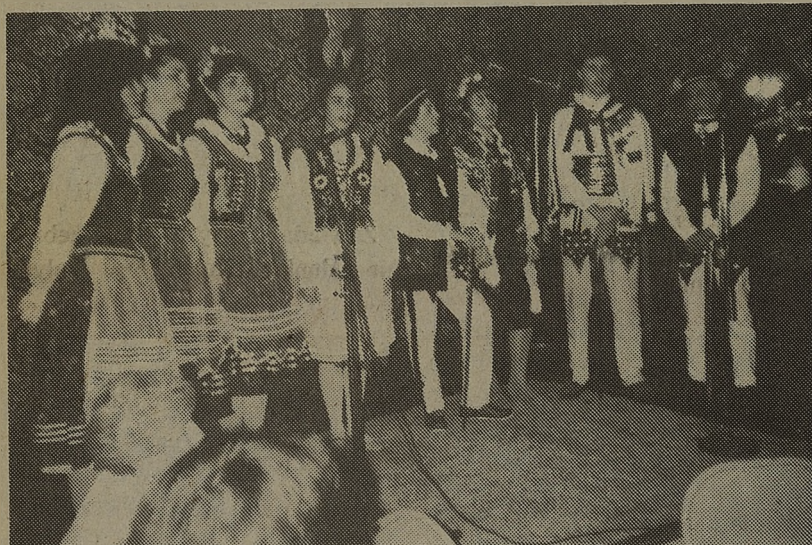
"Wichry" u Kresowiaków.

Na tym kominku harcerki poświęcają też chwilę 45-leciu naszej tu pracy, naszemu wkładowi w tutejsze życie.