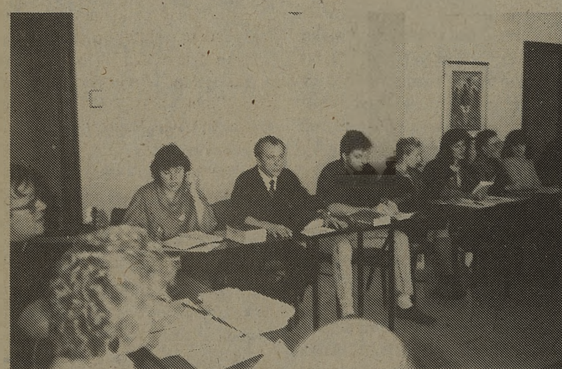
Spotkanie poświęcone problemowi wychowania religijnego — "Kronika" — poniedziałek 30 stycznia.