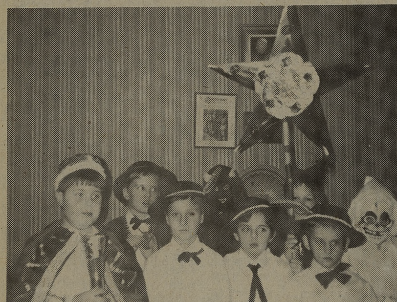
Zespół "Herodów" z gromady "Chłopcy z lasu" na "Oplatku" 5-tej D.K.P.