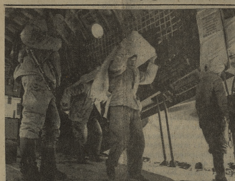
KABUL — Związek Sowiecki dostarcza żywności dla głodujących mieszkańców oblężonego przez partyzantów Kabulu. Na zdjęciu, robotnicy afgańscy rozładują transport mąki z ZSSR.

Zwycięstwo Rządowych Reformatorów Budapeszt (ST) — Komunistyczna Partia Węgier godzi się na wielopartyjny system zarządzania przyznając, że wprowadzony 40 lat temu jednopartyjny system nie spełnił oczekiwań. "Doszliśmy do wniosku, że dłużej nie osiągniemy postępu idąc tą drogą" — oświadczył szef KPW, Karoly Grosz na zakończenie dwudniowej sesji nadzwyczajnej, która miała miejsce ostatniego weekendu.