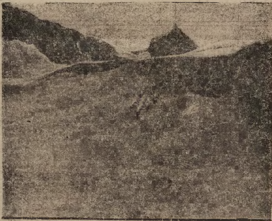
Wspaniały teren górski w Adebodenie, ulubione miejsce narciarzy, zjeżdżających z szczytów błyskawicę ze stromych stoków.

Na swiaty MATERJAŁY męskie i damskie z fabryk Bielskich oraz welwety plusza, zefiry, pł. tna, koldry itp. udziela F-a Lublin i Volk, Lwów, Sobieskiego 8 3706