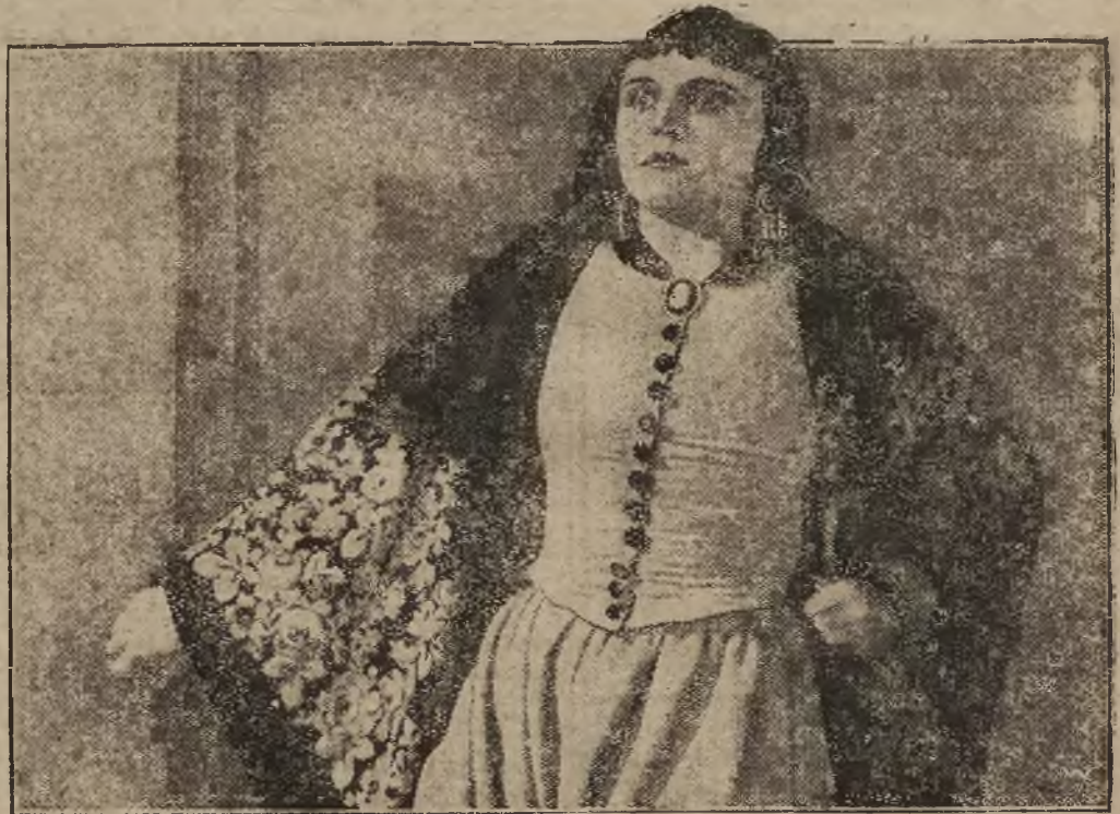
Pola Negri gwiazda filmowa Pola Negri zdobyła w Ameryce ogromną popularność. Rycina na za przedstawia ją w najnowszym filmie pt. „Królowa nocy”.