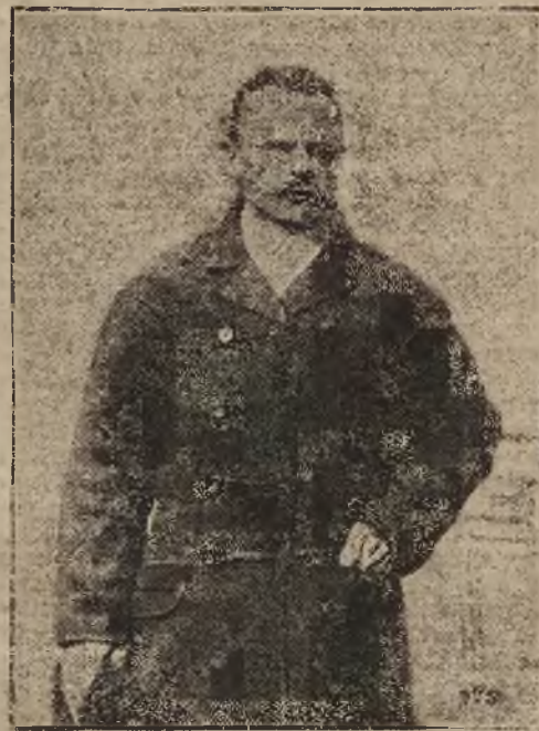
Senator Władysław Wiącek wszedł na miejsce senatora śp. Ernesta Adama z okręgu wyborczego m. Lwowa.

wdowiec, młody spokojne życie, pragnie nawiązać w celach matrymonialnych korespondencję z czterdziestoletnią kobietą, rozporządzającą nawet małymi środkami materialnymi, lecz posiadającą drewnianą nogę sztuczną“. Pewien zaś Anglik ogłasza w dzienniku Birmingham'skim, że „chętnie zawrze związki małżeńskie z wdową, której mąż został powieszony, względnie stracony na fotelu elektrycznym. W ten sposób zaoszczędzone mi będą codzienne hymny pochwalne, śpiewane przez przysłą połowę na cześć mego poprzednika“.