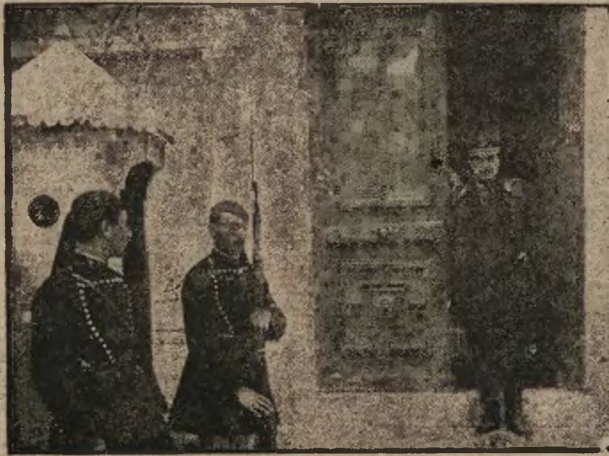
General Kondris, przywódca ruchu wojskowego w Grecji, opuszcza gmach Ministerstwa spraw wojskowych.

PIA słoneczne pokoje — umioblowane z kuchnią — czeszenka, gaz, elektryka do wynajęcia. Listy pod „Piano” do Adm. Wiad. 19982