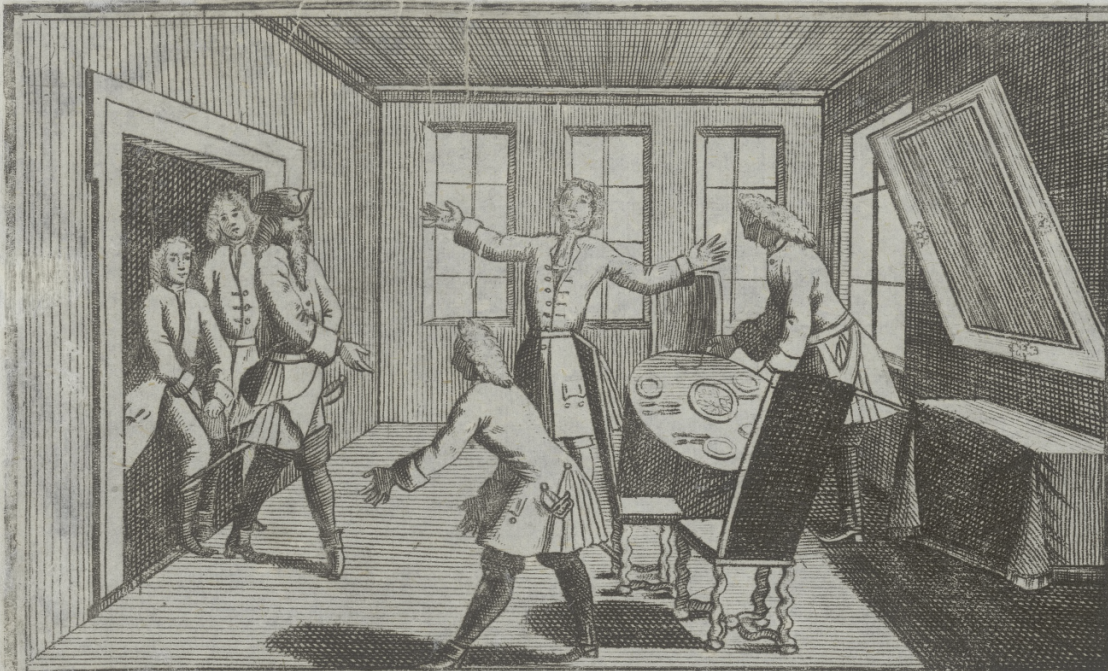
Der König: Majest. in Schweden wird bey seiner ankünfft zum General-Dücker geföhrt.