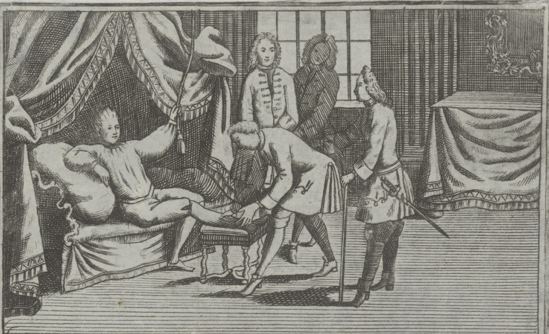
Dem König legt der Feldscherer ein pflaster auf seine alte Wünder.