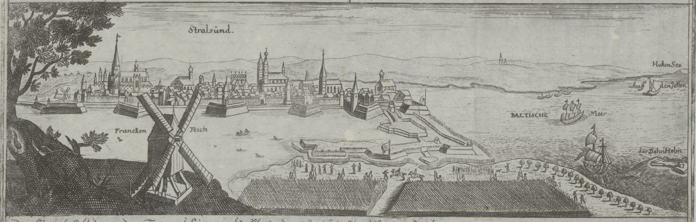
Das Gemälde zeigt den andern Tag nach seiner ankünfft aus den Dücker in Stralsünd.