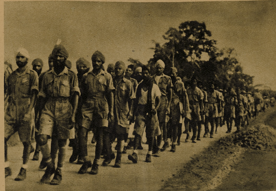
ІНДІЙСЬКА ВИЗВОЛЬНА АРМІЯ

ГАЛИЦЬКА ЗЕМЛЯ ПЕРЕЖИВАЄ ЗНОВУ ОДИН ІЗ НАЙСТРАШНІШИХ ПЕРІОДІВ У СВОЙ МНОГОСТРАДАЛЬНИЙ ТИСЯЧЕЛІТНІЙ ІСТОРІЇ. ВІЙСЬКА ЧЕРВОНОЇ МОСКВИ ПЕРЕСТУПИЛИ В РІЗНИХ ПУНКТАХ КОРДОНІ ГАЛИЧИНИ, ПРИНЕСЛИ З СОБОЮ ВЕСЬ ЖАХ НОВІТНЬОЇ ВІЙНИ ТА ВОСКРЕСИЛИ У ПРИКОРДОННІЙ СМУЗІ ШЕ ЖАХЛИВШУ ДІСНІСТЬ З РОКІВ 1939/40. У НІМЕЦЬКИХ ВОЕННИХ ЗВІДОМЛЕННЯХ ПОЯВИЛИСЯ ВЖЕ ТАКІ НАЗВИ ГАЛИЦЬКИХ МІСТ ЯК ТЕРНОПІЛЬ, БРОДИ, СТАНИСЛАВІВ, ДЕЛЯТИН. ЗОКРЕМА МІСТО ТЕРНОПІЛЬ УВАЛЯЄ СОБОЮ СЬОГОДНІ ВЖЕ ЛИШЕ КУПУ РУМОВИЩ, ЩО ВСЛАВИЛИСЯ ГЕРОЙСЬКОЮ БОРОТЬБОЮ ІХ ОБОРОНЦІВ. ГАЛИЧИНА СТАЛА БЕЗПОСЕРЕДНІМ ТЕАТРОМ ВІЙНИ, СОВЄТСЬКОГО НАСТУПУ ТА ПРОТИАТАК НІМЕЦЬКО-МАДЯРСЬКИХ ВІЙСЬК. У ЦІЙ ІСТОРИЧНІЙ ХВИЛІНИ ВСЕ УКРАЇНСЬКЕ НАСЕЛЕННЯ КРАЮ ЗНОВУ ВИЯВИЛО ПОВНУ СВОЮ ЗРІЛІСТЬ. ВОНО ЗБЕРЕГАЄ ХОЛОДНУ КРОВ, МУЖНО ДИВИТИСЯ НЕБЕЗПЕЦІ В ОЧІ, НЕ ТРАТИТЬ НЕРВИ І ВІРИТЬ, ЩО ЦЕ НОВЕ ЛИХОЛІТТЯ, ЦЕ ЗНОВУ ЛИШЕ ОПІЗОД В ІСТОРІЇ ГАЛИЦЬКОГО КРАЮ. МОСКОВСЬКІ ВІЙСЬКА БУЛИ ВЖЕ НА ТЕРИТОРІЇ ГАЛИЧИНИ НЕРАЗ. ЧЕРЕЗ ГАЛИЧИНУ МАШЕРУВАЛА АРМІЯ ГЕНЕРАЛА ПАШКЕВИЧА ТОМУ НЕСПОВНА СТО РОКІВ ПРОТИ МАДЯРЩИНИ, ПІДЧАС ПЕРШОЇ СВИТОВОЇ ВІЙНИ МОСКАЛІ ЗДОБУЛИ БУЛИ ПЕРЕМИШЛЬ І ЗАГНАЛИСЯ БУЛИ АЖ ПІД ГОРЛИЦІ, А ПІДЧАС ЦЬОЇ ВІЙНИ 21 МІСЯЦЬ ГАЛИЧИНА ТЕРПІЛА ПІД ЯРМОМ „ВИЗВОЛЬНИЦЬКИХ“ ЧЕРВОНИХ ВІЙСЬК. ТЕПЕР ВОНИ ЗНОВУ ВМАШЕРУВАЛИ І ТАКСАМО ВІДИЙДУТЬ, ЯК ЗАВСІДИ ВІДХОДИЛИ ДО ЦЬОГО ЧАСУ.