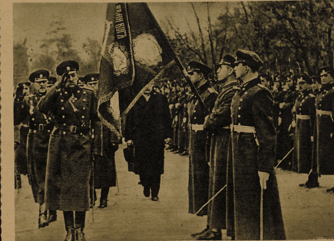
РОКОВИНИ ВИЗВОЛЕННЯ БОЛГАРІЇ

Бачимо тут вутро одної з великих німецьких фабрик літаків. Та фабрика — таксамо, як багато інших, продукує серійно ловецькі літаки, які є могутньою обороною та офензивною зброєю німецької армії. Ця світлина яскраво говорить про незламну силу німецької воєнової продукції. Завдяки цій силі протилітунської оборони, за три перші місяці 1944 р. збито над Німеччиною і занятими землями 2926 англо - американських літаків, у тому числі 2300 бомбардувальників. Разом з ними згинило коло 19 тисяч аліантських літунів.