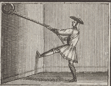
Hier Zureißet Er ein starkes Seil,