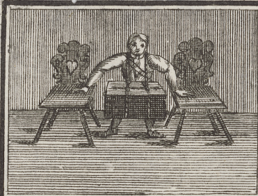
Wie Er hier einem Stein von 3. oder 4. \ell . mit dem Karren aufhebet,