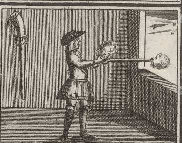
Hier Zeiget Er etliche Kunststück,