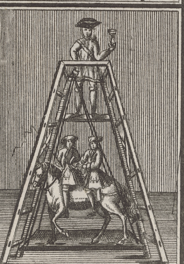
Hier hebet Er ein Pferd u. 2. Personen mit einer Hand auf.