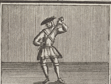
Hier trethet Er ein ein Grosen Nagel, wie einem Chor,