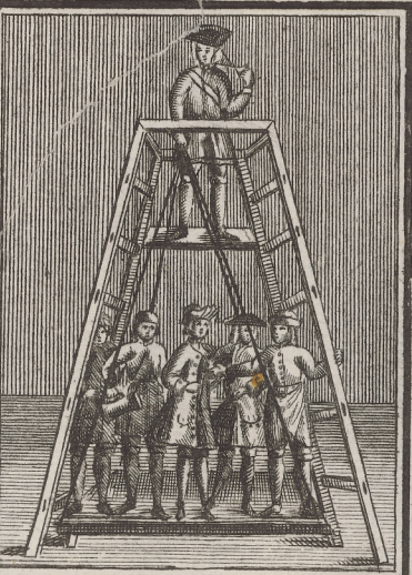
Hier hebet Er mit einer Hand 3. 6. Personen auff