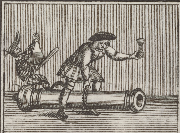
Hier hebet Er mit einer Hand eine Canonen von 10. \ell . schwer auff.