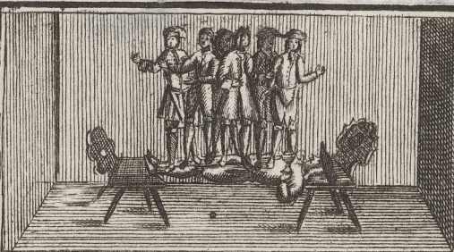
Alhier laßt Er 6. Personen sich auff den hohem Leib treten und Trüncket ein Glas wein