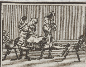
Wie Er sich auff der Brust laßt einen Stein von 3. bis 4. \ell . zu schlagen